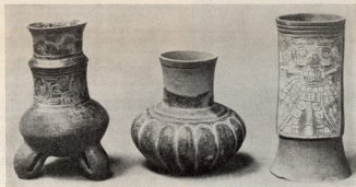
Cacharros de Vera Cruz (México) que acusan influencia maya.