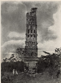
Nochichic. La Torre Esbelta.