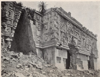
Uxmal. Palacio del Gobernador.

the Early Maya civilization, the countries to the west were also affected by it to a very high degree. Maya art spread also to the west, where it exerted a profound influence on the populations of Salvador and Oaxaca. By this route it spread to the Mexican Valley, where it took root and flowered under rather different conditions and in an altered form.