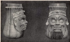
Uno de los más finos ejemplares conocidos de la cerámica maya. Vaso encontrado en Quiriguá (Guatemala).

combinada de un Español y de un Inglés. La descripción que nos ha dejado el Obispo Landa del sistema de calendario de los Mayas del Yucatán en el siglo XVI, aplicado a la notable serie de vaciados y fotografías de primitivas inscripciones mayas obtenida por el Dr. Matudalay en el siglo XIX, establecieron los fundamentos para el estudio de la escritura maya.