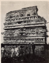
Chichénitza. Período maya "Nuevo Imperio". Edificio llamado la Iglesia, anexo al Palacio, adornado con relieves en mosaico.

posteriores, la figura va surgiendo gradualmente del bloque y aproximándose más y más a la escultura exenta. En realidad, el escultor maya fué gradualmente dándose cuenta de las nuevas posi-