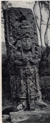
Copán. Estela de piedra. Período maya primitivo.

the legitimate inheritors in Yucatan receiving, in the end, a new inspiration from a westward branch, which had been modified, first by the Zapotec tribes of Oaxaca, and second by the Toltec of the Mexican Valley. Meanwhile Maya inspiration provided the basis of Aztec art.