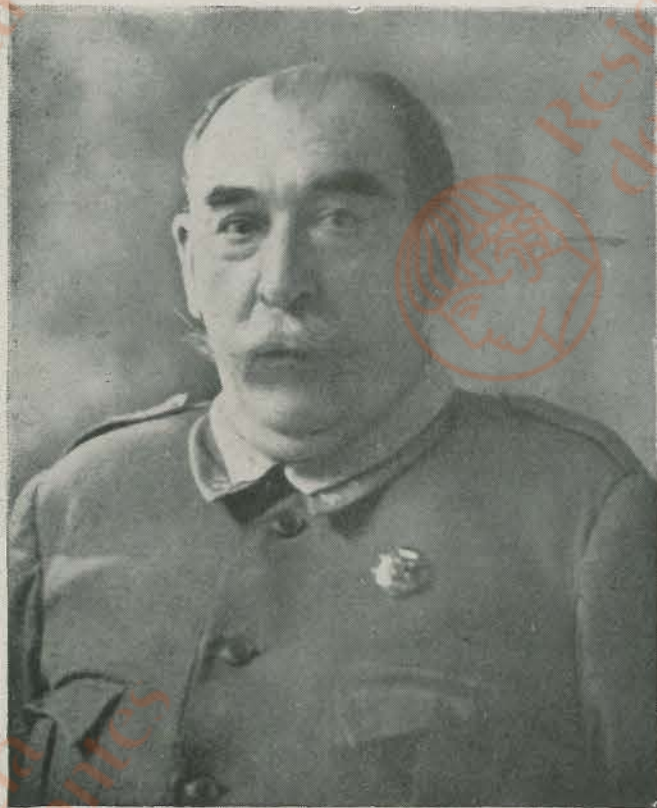
EXCMO. SR. DON ANDRES SALIQUET ZUMETA, teniente general.—Durante la guerra de Liberación de España mandó el Ejército del Centro, logrando obtener triunfos rotundos sobre la horda roja hasta que fué expulsada definitivamente de la capital de España. Tuvo el teniente general Saliquet otras brillantes intervenciones en el Ejército de Aragón, que le acreditaron como experto militar.