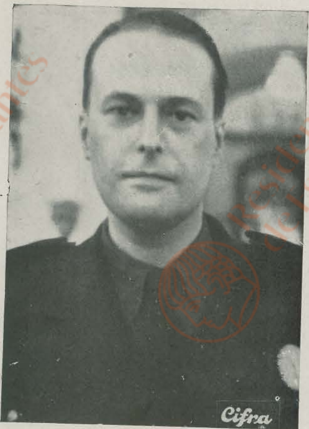
DON JOSE LUIS ARRESE. —La personalidad del señor Arrese es una de las más destacadas en la nueva España nacional-sindicalista. Antiguo falangista y amigo del inolvidable fundador de la Falange, José Antonio, siempre presente, colaboró con él desde los primeros instantes y fué uno de sus más decididos y entusiastas admiradores. Al iniciarse el glorioso Alzamiento nacional se puso, incondicionalmente, al servicio de la España de Franco, prestando valiosos servicios al Movimiento en cuantos puestos de responsabilidad le fueron confiados, entre ellos el de gobernador civil de Málaga. Es Consejero de Falange y miembro de la Junta Política, y, por sus dotes de cultura e inteligencia, uno de los más sólidos prestigios de la nueva España.