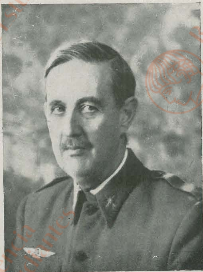
EXCMO. SR. DON ALFREDO KINDELAN, teniente general, prestigiosa autoridad en aeronáutica militar. Durante la guerra de Liberación desempeñó con gran acierto la Jefatura del Aire, dotando a nuestro Ejército de una Aviación eficiente y disciplinada que contribuyó de una manera relevante a la victoria sobre los enemigos de España.