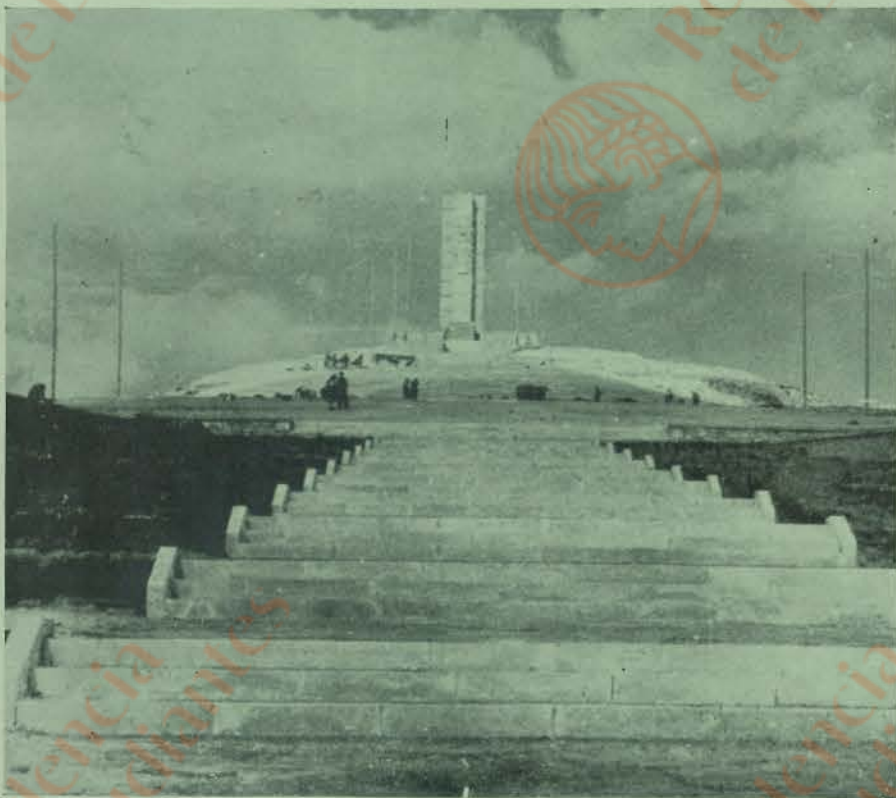
ALCOCERO DE MOLA (BURGOS). — Vista general del monumento al glorioso general Mola, donde tuvo lugar el accidente de aviación.