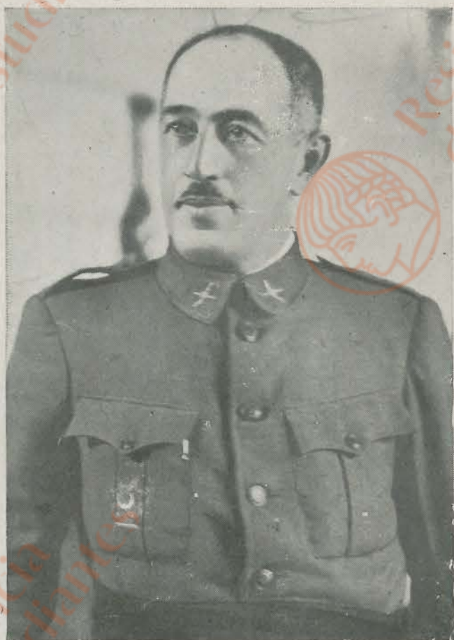
General de Brigada DON ANTONIO LOS ARCOS.—Durante la guerra española se distinguió por sus altas dotes de mando al frente de una de las brigadas navarras, que al principio de la campaña iniciaron en el Norte una serie de victorias que condujeron al triunfo final sobre los sicarios de Moscú.

La vasta cultura y conocimiento profundo de los problemas militares que posee el coronel de Estado Mayor DON ANTONIO BARROSO constituyen una eficaz y definitiva aportación a las victorias que lograron los soldados nacionales y al triunfo definitivo de la España de Franco.