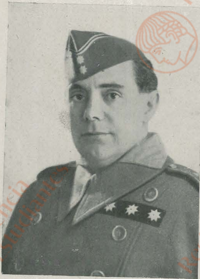
General de Brigada DON ANTONIO CASTEJON ESPINOSA, de altas virtudes militares y patrióticas, formadas en el duro yunque de las campañas marroquíes, pacificador de una buena parte de Andalucía en los comienzos del Movimiento Nacional. Fué uno de los jefes que con su pericia y dotes de mando condujeron el Ejército victorioso desde las plazas africanas hasta las mismas puertas de Madrid.