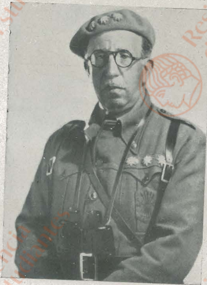
EXCMO. SR. DON ANTONIO SAGARDIA RAMOS, general de Brigada que, al frente de los bravos requetés y falangistas de una de las brigadas navarras, actuó con brillantez en la campaña, contribuyendo de un manera eficaz a su liberación, y después a la victoria total del Ejército nacional, tomando parte en otros gloriosos hechos de armas.