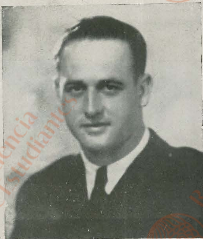
El malogrado teniente coronel DON JOAQUIN GARCIA MORATO. As de la Aviación española, cuyas alas victoriosas se cernieron en arrogante supremacía sobre el adversario. Caballero del aire, su pericia, su valor y su intrépido arrojo condujeron siempre a la escuadrilla que capitaneaba a las hazañas más inverosímiles y a los más resonantes triunfos, cuyo eco repercutió fuera de las fronteras, despertando la admiración y el más encendido homenaje de todos hacia la gloriosa Aviación española.