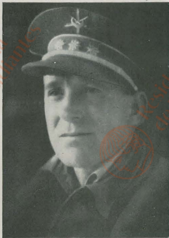
GENERAL DE DIVISION DON EDUARDO SAENZ DE BURUAGA.—Pertenece a esa pléyade de bravos militares formados en largas campañas marroquíes que tanto prestigio han dado al Ejército español, y que con la guerra de Liberación dieron pruebas de su elevado espíritu castrense y dotes de mando