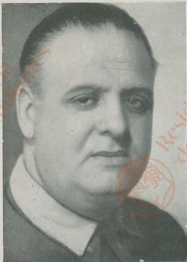
DON JUAN DE LA CUESTA, coronel de Estado Mayor, uno de los más preclaros jefes del glorioso Ejército de Franco.