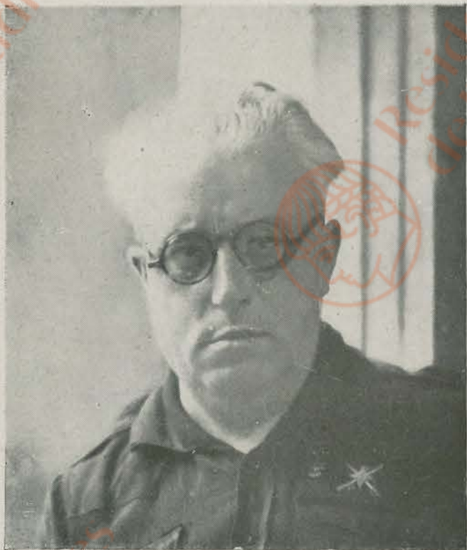
El GENERAL MIZZIAN, prototipo de la lealtad marroquí hacia España, que al mando de una unidad del Ejército de Africa colaboró con gran eficacia en la campaña de Liberación junto al general Yagüe, contribuyendo con su pericia y altas dotes de mando a no pocas victorias, y, por último, a la rotunda de las armas nacionales.