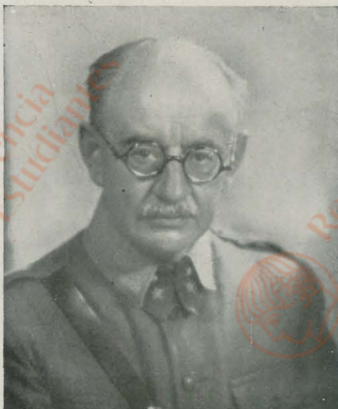
La vasta cultura y elevado patriotismo que concurren en el ilustre general de División DON JUAN VIGON SUERO-DIAZ fueron factores durante la guerra española que contribuyeron al triunfo de las armas nacionales. A la eficaz colaboración del general Vigón, con los demás generales que dirigían las operaciones en el Norte, se debe en gran parte la rápida victoria alcanzada en aquel sector por las armas nacionales.