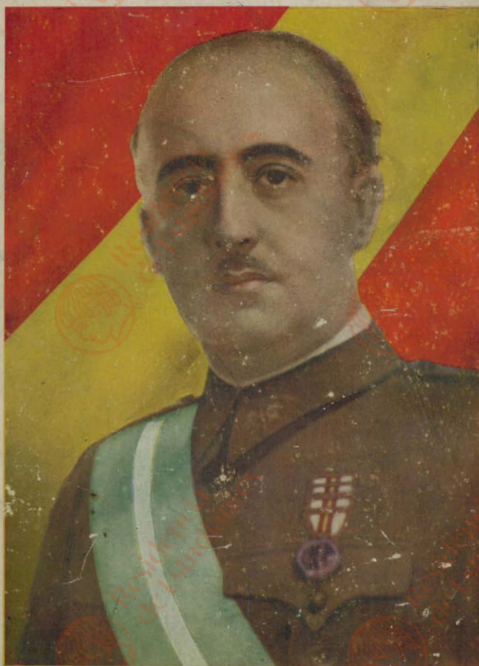
S. E. El Generalísimo Franco