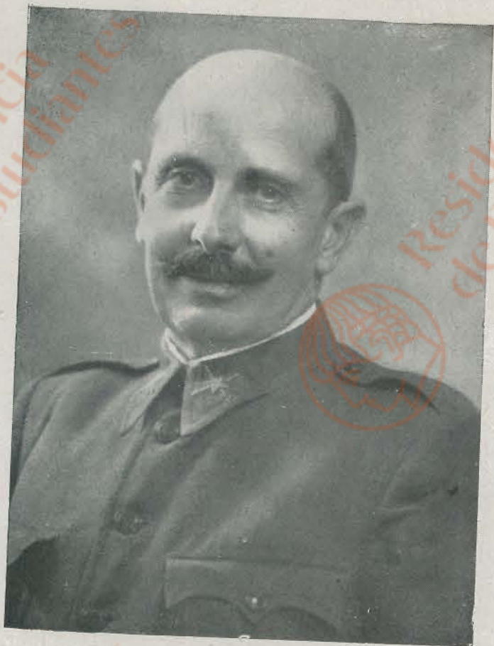
General de División DON JOSE SOLCHAGA, jefe de los bravos requetés, que a la llamada apremiante de España salieron de los pueblos navarros y de los caseríos vascos para sostener los santos ideales de la Religión y de la Patria. Sus legiones intrépidas arrollaron a la horda roja desde Vasconia hasta Cataluña, contribuyendo a rescatar para España las tierras del Norte que gemían bajo la garra siniestra de Moscú.