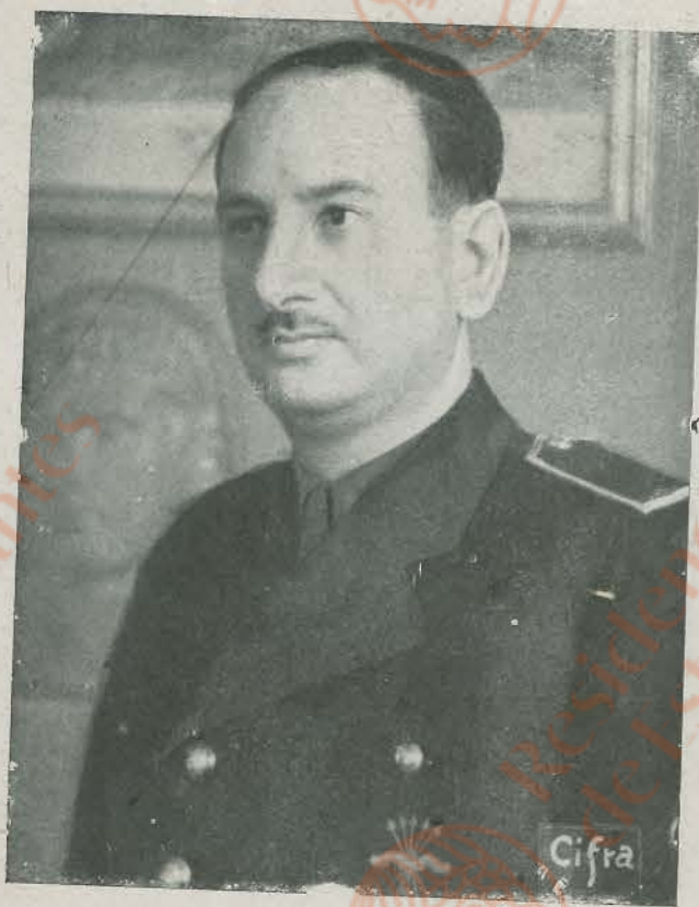
DON BLAS PEREZ GONZALEZ, coronel auditor del Ejército del Aire. Se halla en posesión del título de Doctor en Derecho, ganando por oposición la cátedra de Derecho Civil en la Universidad de Barcelona, de cuyo cargo fué depuesto por el Frente Popular. Ex cautivo de los rojos, que le condenaron a muerte, consiguió huir a la España Nacional, ingresando en la Asesoría Jurídica del Generalísimo. Catedrático de la Universidad Central de Madrid, desempeñó además los cargos de Fiscal del Tribunal Supremo y Delegación Nacional de Justicia y Derecho de Falange Española Tradicionalista y de las J. O. N. S. Es autor de gran número de obras de Derecho Civil y un fiel colaborador del Caudillo en cuantos servicios ha desempeñado en la nueva España nacionalsindicalista.