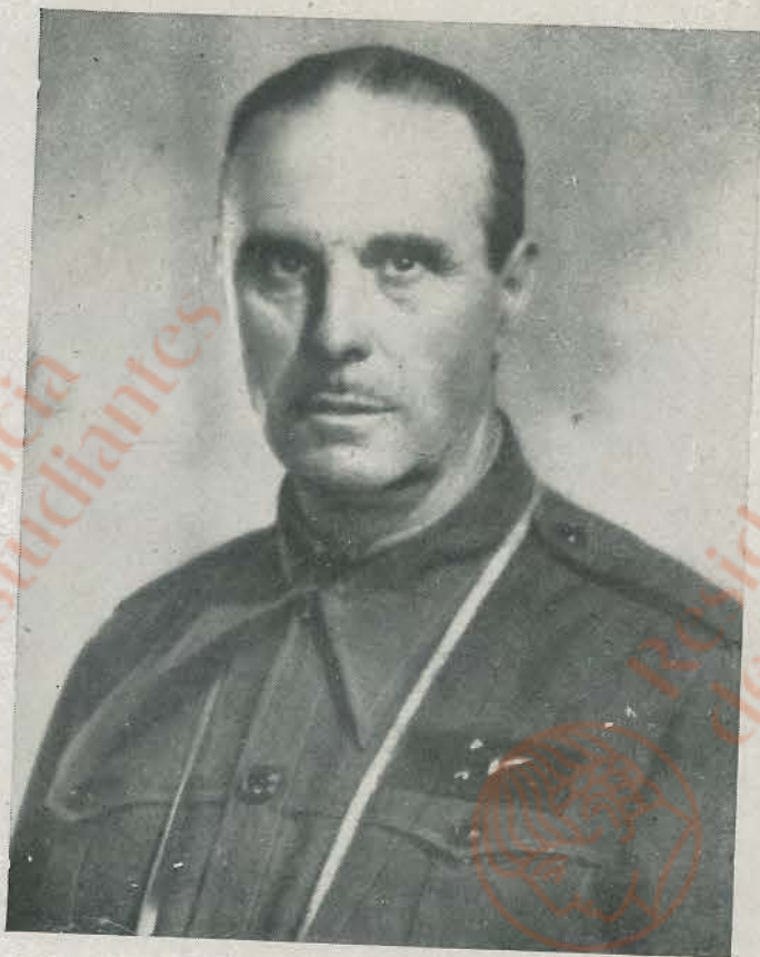
EXCMO. SR. DON FIDEL DAVILA ARRONDO, teniente general, espíritu ecuánime y previsor, condujo victoriosamente al Ejército del Norte, completando admirablemente los planes que trazara el malogrado general Mola para la conquista de Bilbao y Santander. Después desempeñó con gran acierto la Presidencia del primer Gobierno nacional y fué un eficaz colaborador del Generalísimo durante la campaña de liberación.