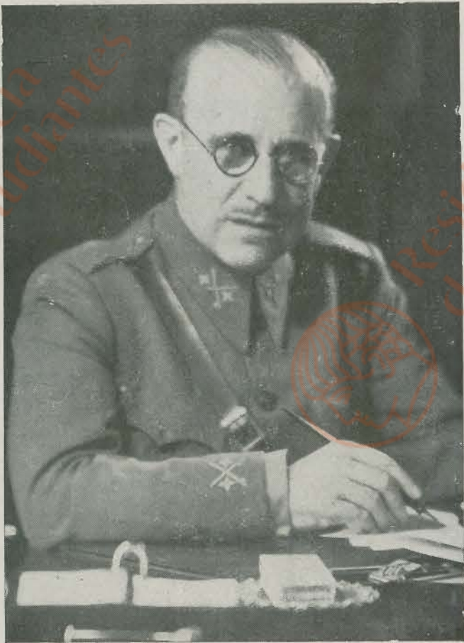
EXCMO. SR. DON FRANCISCO GOMEZ JORDANA, teniente general, uno de los prestigios mayores del Ejército español y gran colaborador del Caudillo en la gloriosa epopeya española. Durante el primer Gobierno de la nueva España desempeñó con gran acierto el Ministerio de Asuntos Exteriores, contribuyendo a la iniciación de las relaciones con muchos países extranjeros, que luego reconocieron al Gobierno nacional.