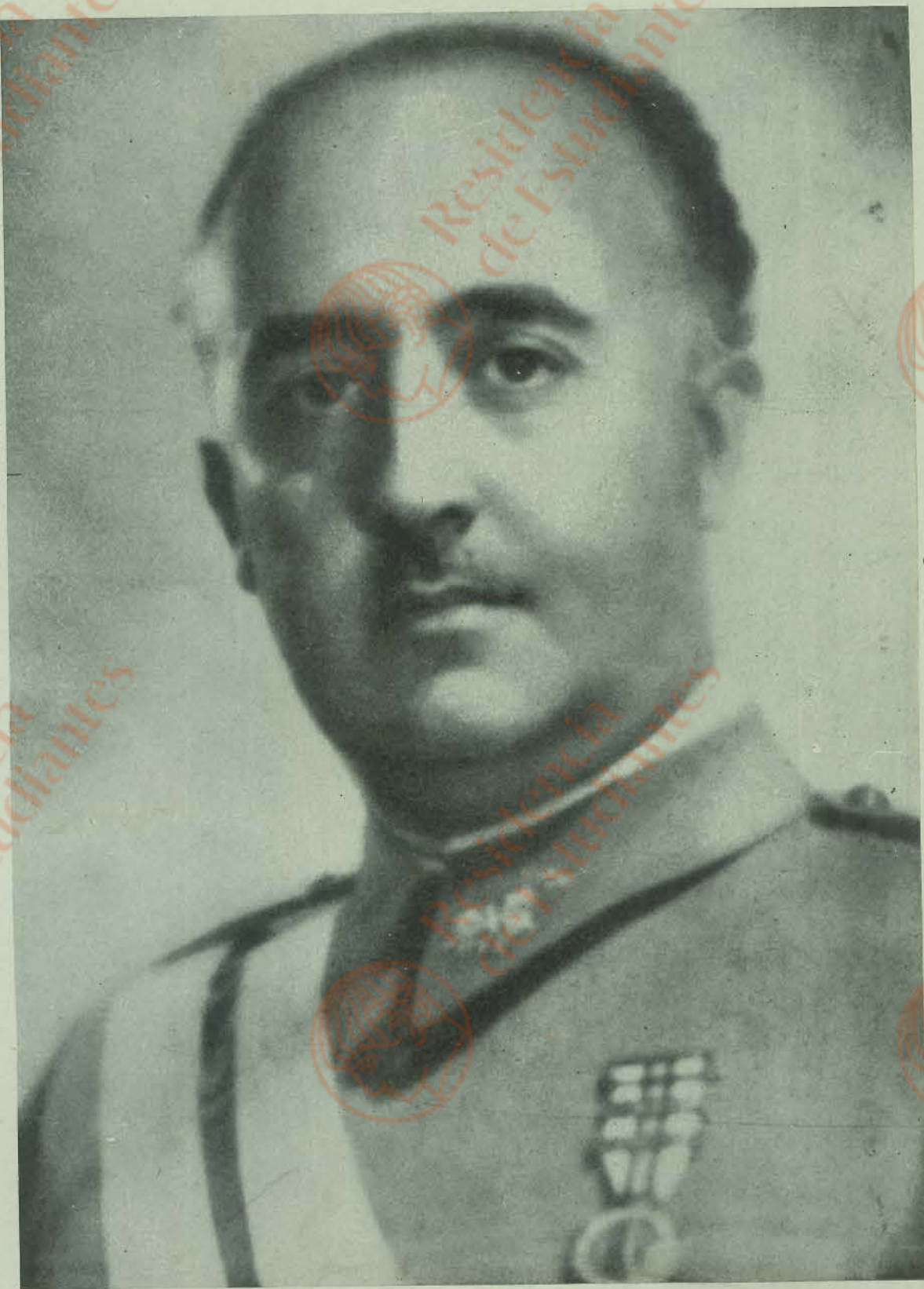
SU EXCELENCIA EL GENERALISIMO FRANCO Reconquistador de España, Caudillo victorioso, espada y toga de la Hispanidad