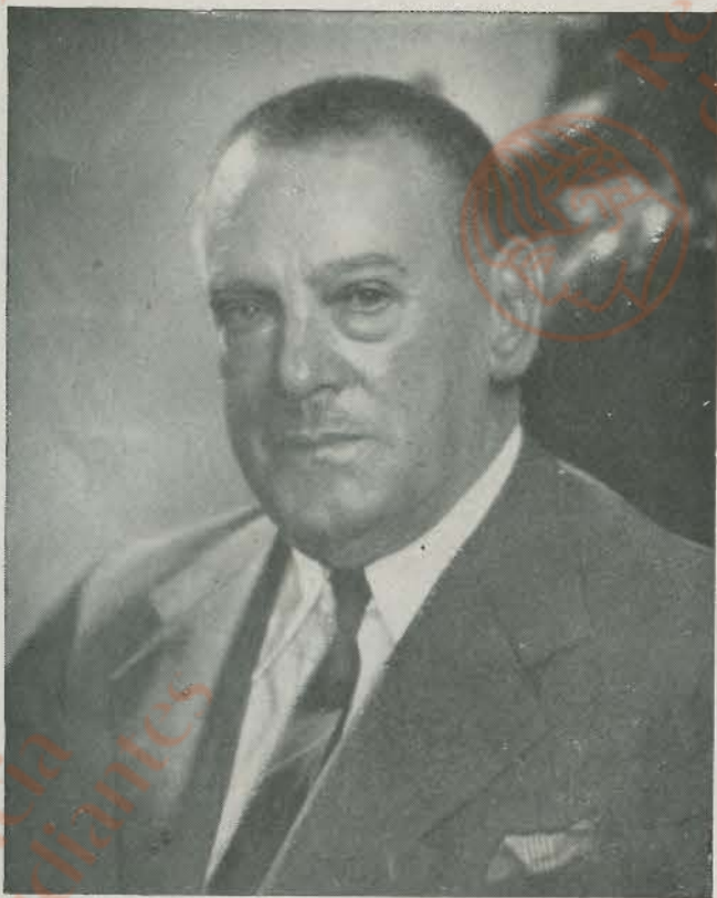
General DON SEVERIANO MARTINEZ ANIDO, en quien concurrieron altas dotes de mando y contribuyó a la pacificación de Barcelona cuando desempeñó el Gobierno civil de la ciudad condal en circunstancias verdaderamente difíciles. Formó parte del Gobierno del general Primo de Rivera como ministro de la Gobernación, desde cuyo puesto desarrolló una labor eficaz, especialmente en el aspecto sanitario. Al general Martínez Anido se debe la iniciativa de crear abundantes sanatorios y preventorios antituberculosos. Cuando su experiencia y el fecundo trabajo del general Martínez Anido ofrecían su colaboración a la nueva España, el ilustre general falleció en Valladolid después de haber prestado relevantes servicios a la Patria.