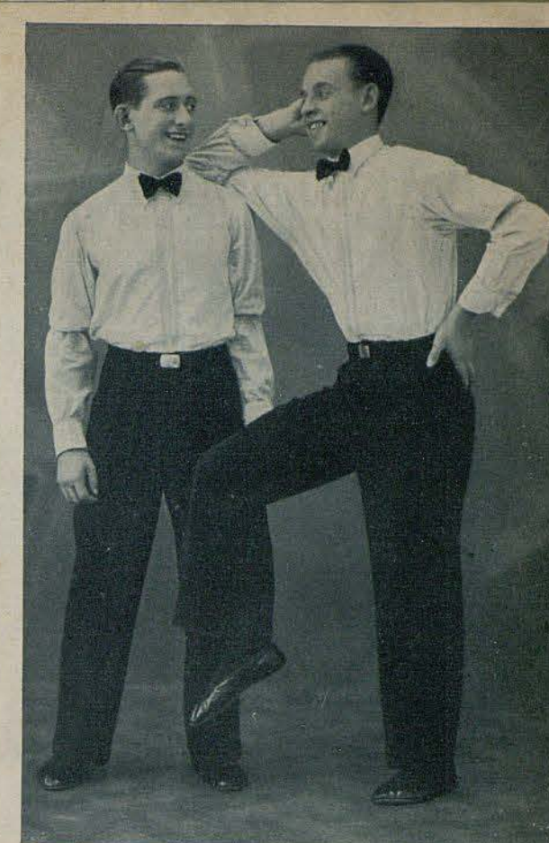
2 Shamrocks Gentlemen-Akrobaten