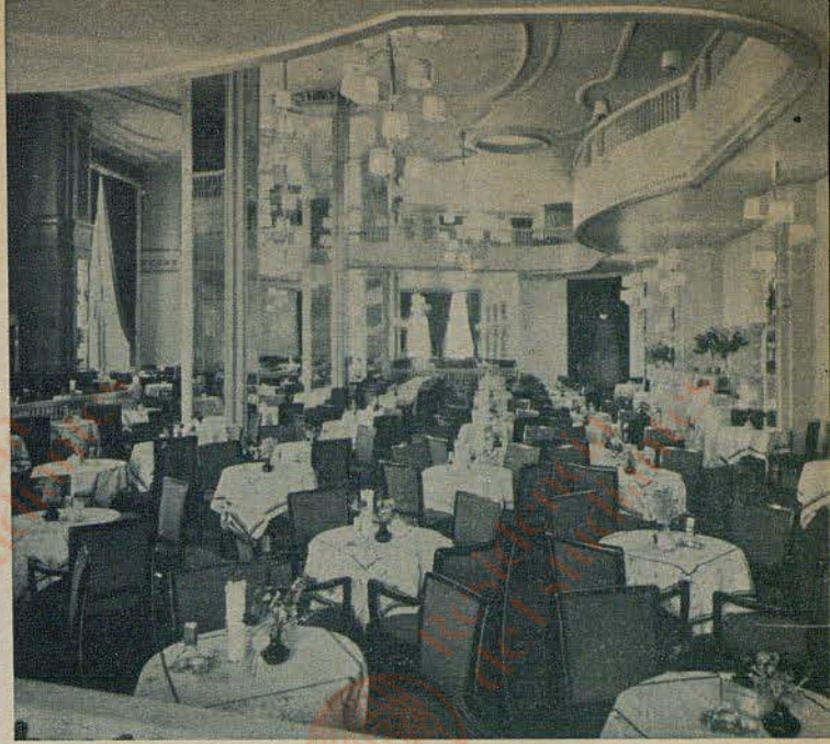
Kempinski Kaffee Trumpf an der Gedächtniskirche

So vielseitig die Sehenswürdigkeiten Berlins sind, so vielseitig ist auch die Möglichkeit, sich in der Reichshauptstadt angenehm zu unterhalten. Angefangen bei der überraschend oft anzutreffenden Gelegenheit, trotz brausendem Großstadtverkehr geruhsam im Freien seine Tasse Kaffee zu trinken bis zum weltstädtischen Vergnügungsunternehmen, das bis weit in die Nacht hinein offensteht. Die gesamten Kempinski-Betriebe — deren Umwandlung in der Geschäftsführung in diesen Wochen bekannt wurde — sind dafür das sprechendste Beispiel. Im „Haus Vaterland“, das man auch wieder unterteilen könnte, da es ja in allen seinen Abteilungen etwas anderes bietet, ist der typische Großstadtbetrieb verkörpert, in dem es die umsichtige Leitung versteht, ständig für Abwechslung zu sorgen. Auf der beliebten „Rheinterrasse“ startet allabendlich ein ausgewähltes Variete-Programm, da durchaus nichts Sommerliches an sich hat, sondern ebensogut im Winter vor den Augen verwöhnter Gäste bestehen könnte. Im „Oberbayern“, das stيلة ausgestattet wurde, kann man eigentlich das ganze Jahr „Oktoberfest“ spielen, jedenfalls sprechen Stimmung und Trubel dafür. Die alte Romantik des „Heurigen“ — um die man jetzt in Wien fürchtet, weil der Verkehr sein Opfer fordert und das verwinkelte alte Weindorf Grinzing „durchbrochen“ werden soll — ist im Berliner „Grinzing“ im Haus Vaterland unangetastet. Der „Palmensaal“ bleibt eine Sehenswürdigkeit für sich ebenso wie die weite, das hohe Haus am Potsdamer Platz