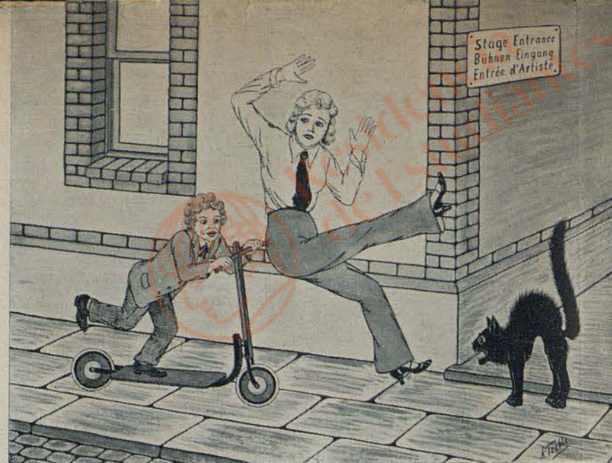
Ilrè und Billy