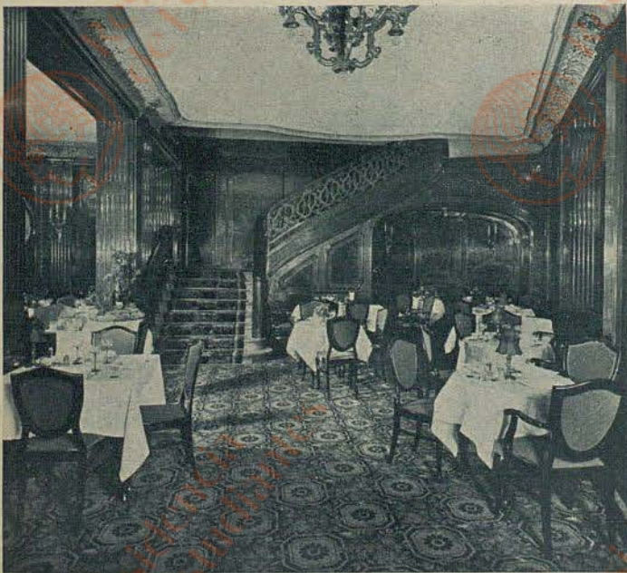
Kempinski Weinstuben Kurfürstendamm

Fahren wir noch weiter nach Westen: Das Kempinski-Hotel „Schloß Marquardt“ nahe Potsdam, in unvergleichlich schöner Umgebung, ist im Vorsommer ein herrliches Ziel für den, der einmal ausspannen und wirklich freie Natur genießen will. Nur ein paar Schritte sind es von den schönen Gasträumen durch den alten Park zum Strand mit seinen Badekabinen (die ersten Wasserratten waren schon da und haben sich ordentlich im Schlänitzsee getummelt), mit der kleinen Bootsflottille und in den nahen Wald. Dazu alle Annehmlichkeiten eines gut geführten, modernen Hauses — mehr kann man kaum verlangen.