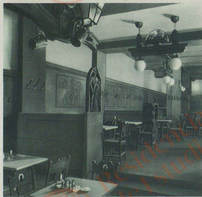
Hotel Excelsior Berlin Abt. Zur Stadtschänke (Teilansicht)