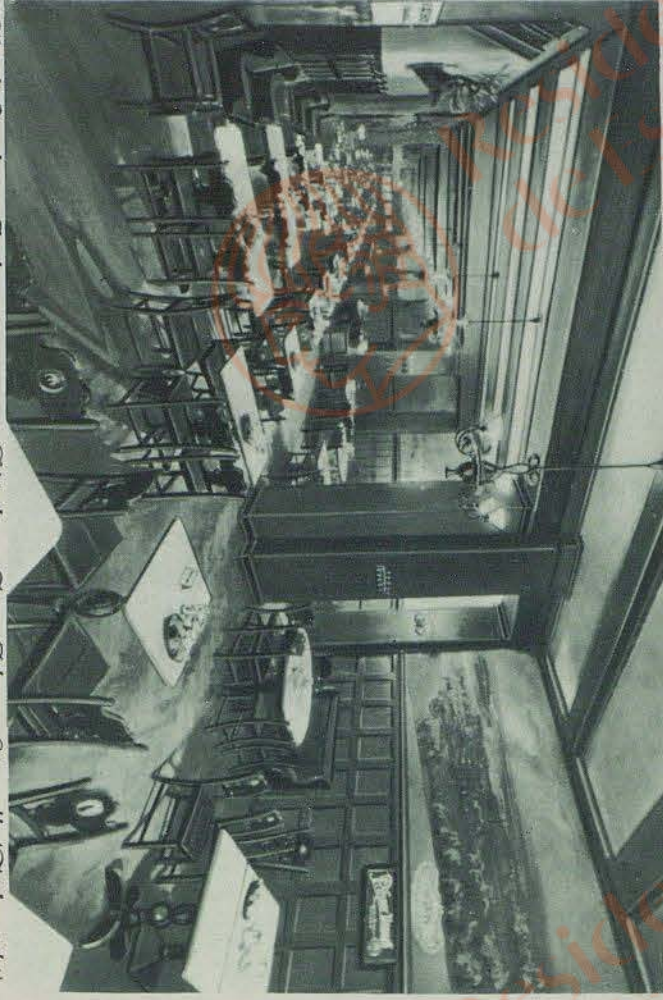
Abteilung Zum Pilsener Urquell (Teilansicht)