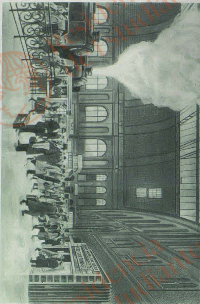
Gründer Bahnhof Direkte Verbindung durch Fahrstühle und Tunnel zum Hotel