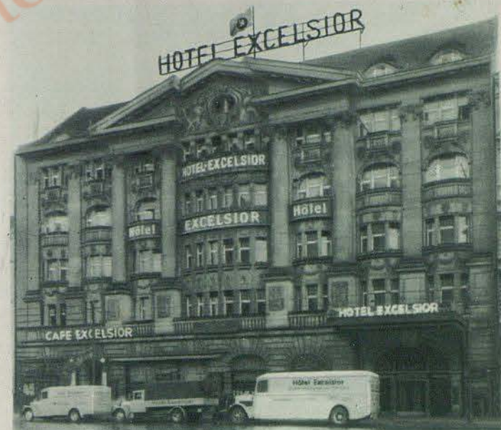
Hotel Excelsior Berlin