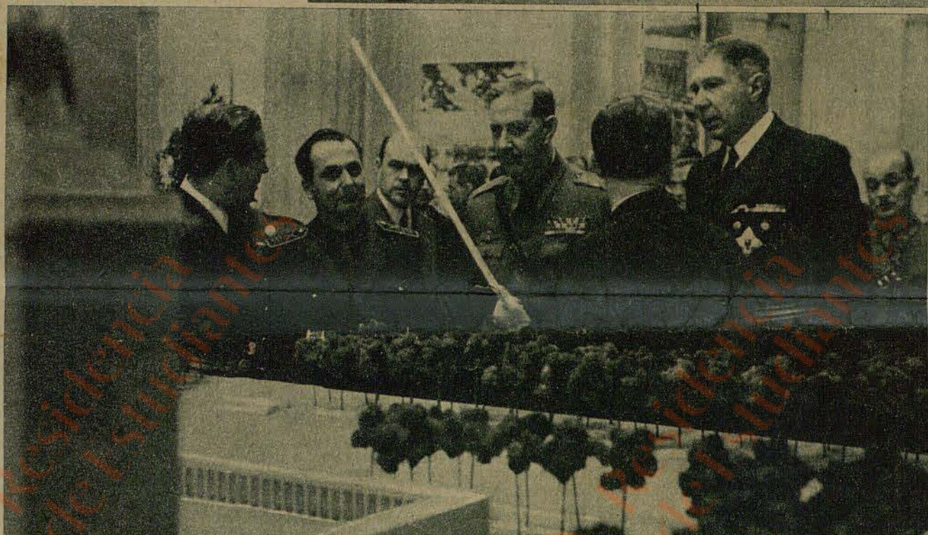
Barcelona. - El cónsul general de Alemania, doctor Jaeger, pronunciando el discurso inaugural de la Exposición

El embajador de Alemania en España, Von Stohrer, con el capitán general de la región, don Alfredo Kindelán, el gobernador civil y jefe provincial del Movimiento, señor Correa Véglisson, y otras personalidades contemplando una de las bellas maquetas expuestas.