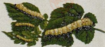
Maulbeerzweig mit Raupen des Seidenspinners