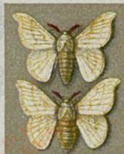
Seidenspinner (Bombyx mori)