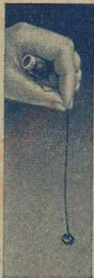
Die Seiden- probe durch An- brennen des Fadens.