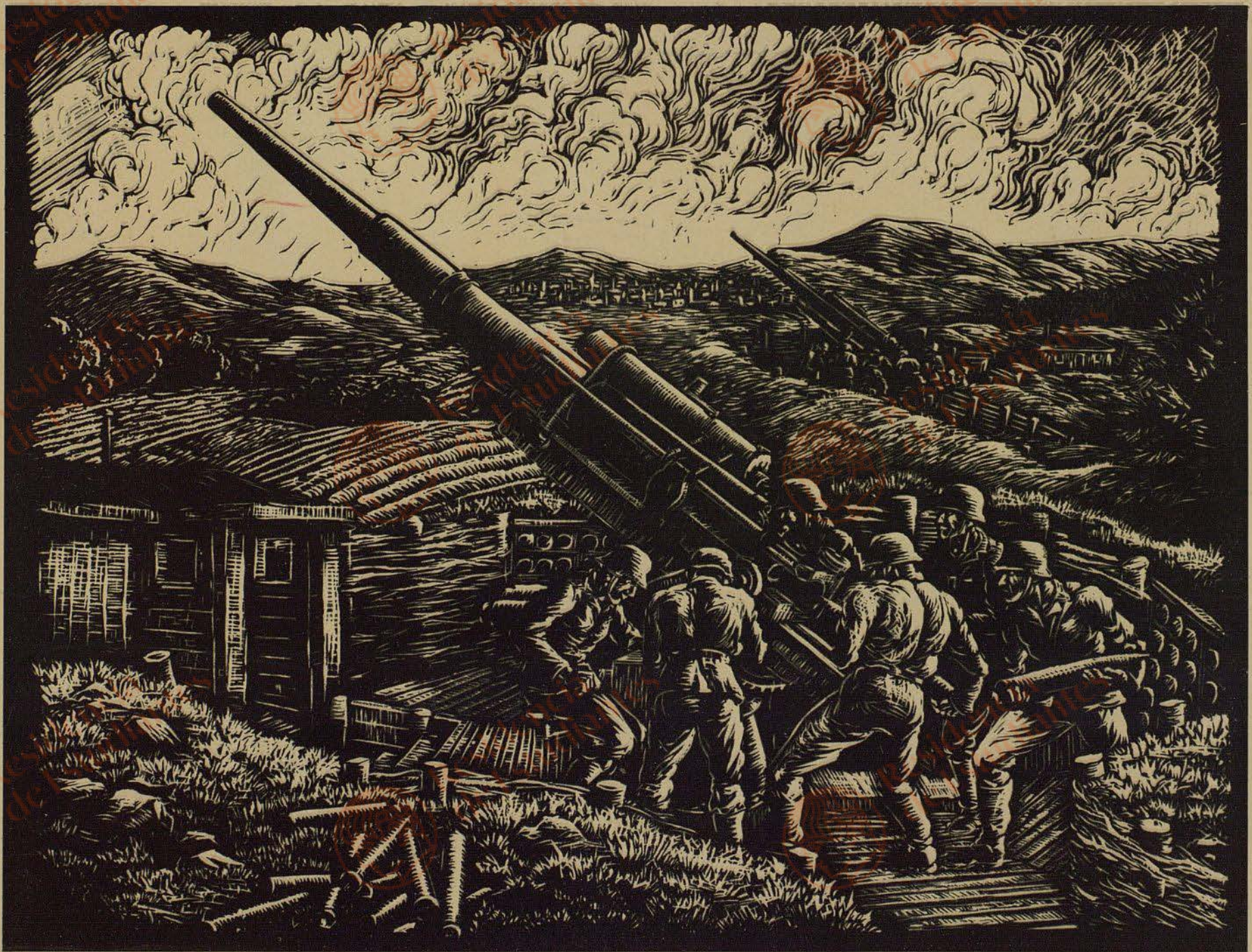
Walther Cauer: Batterie in Stellung