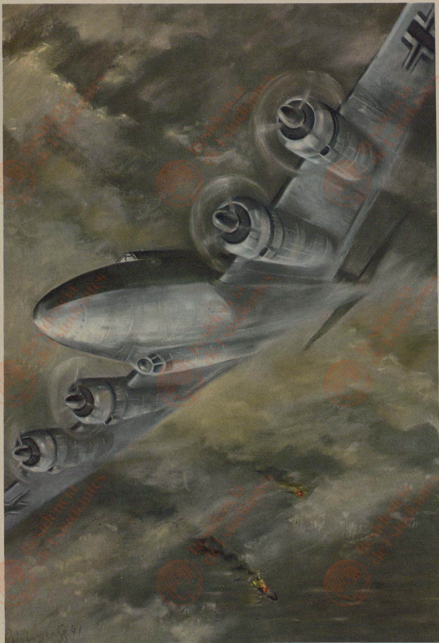
Georg Reisinger: FW 200 (Condor)