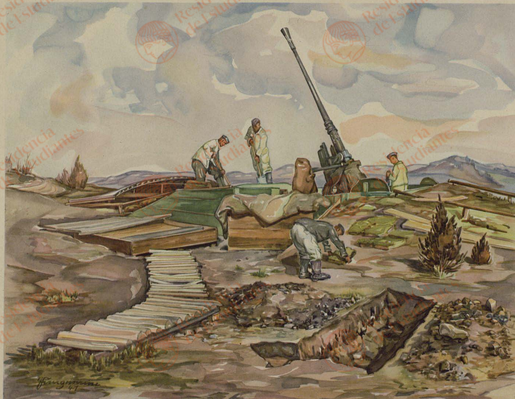
Wilh. Jungmann: Stellungsbau auf der Alb