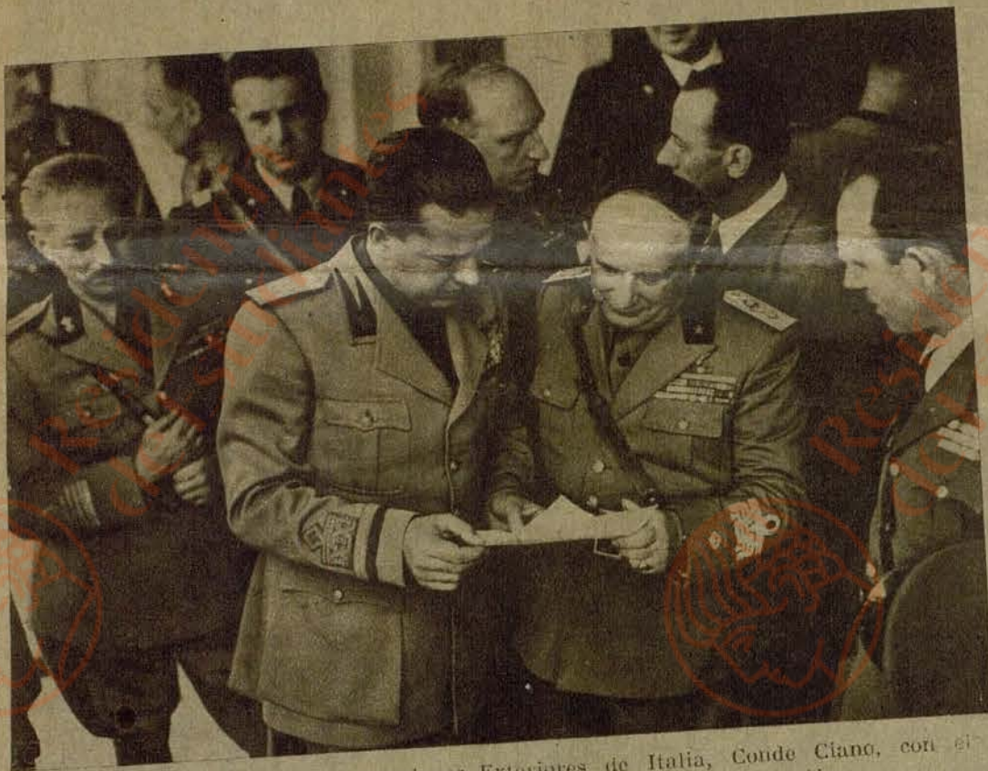
Tirana. — El Ministro de Relaciones Exteriores de Italia, Conde Ciano, con el General Guzzoni, Jefe de las fuerzas italianas de ocupación.