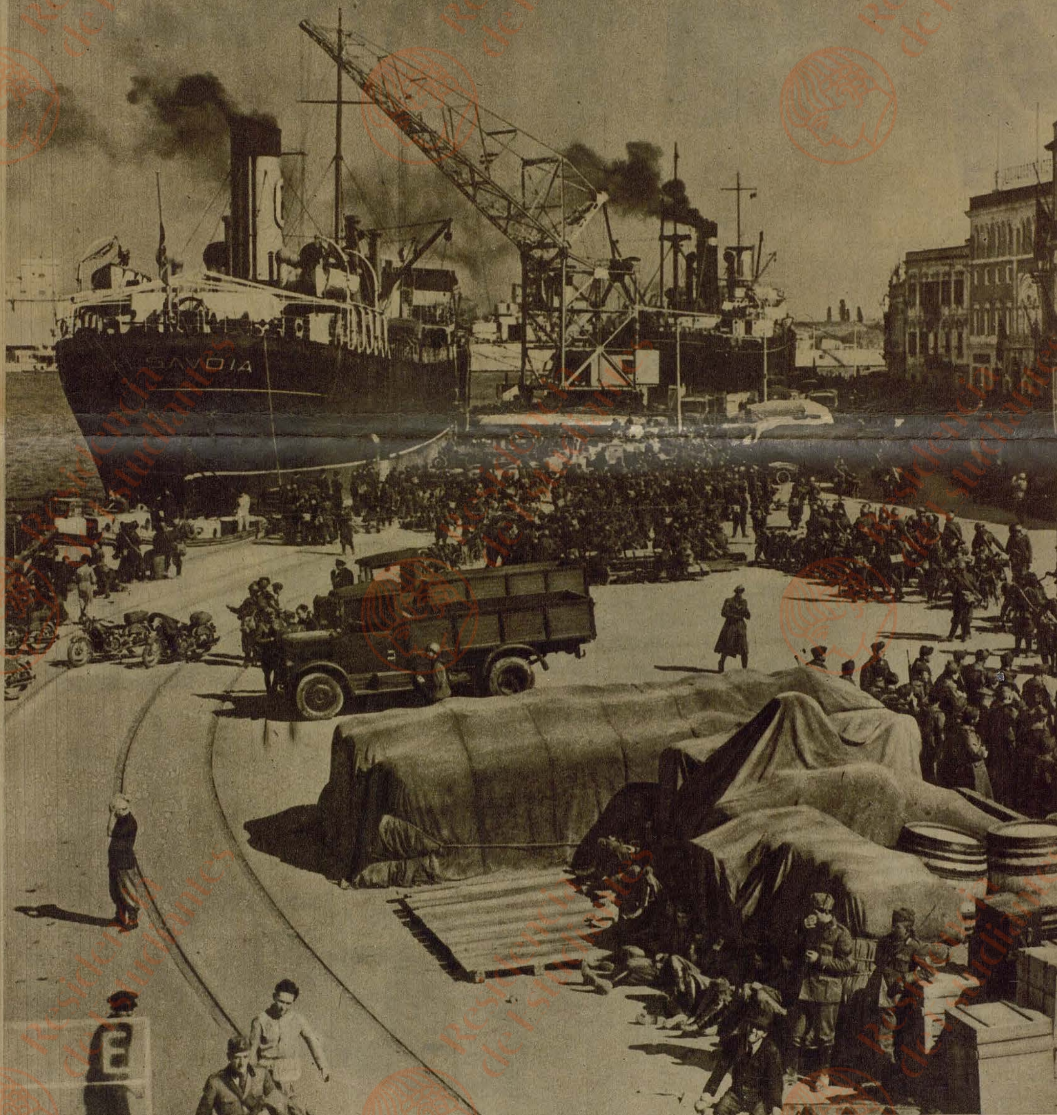
El desembarco, en Durazzo, de las fuerzas de ocupación