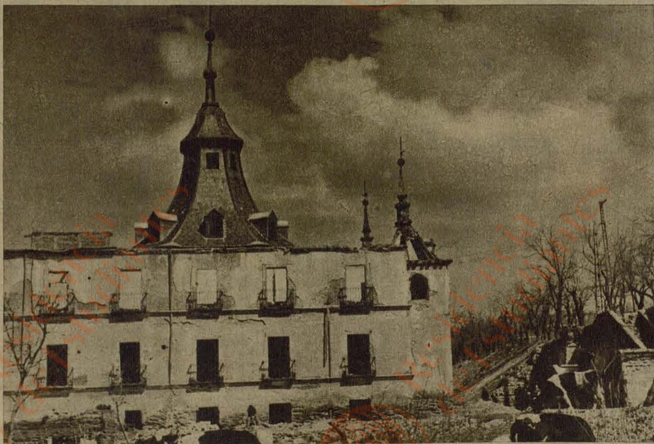
Madrid. — Santuario de la Virgen del Puerto, en las proximidades de Madrid, bárbaramente destruido por los rojos