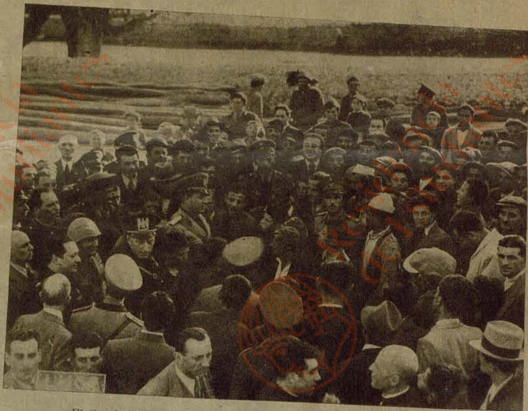
El Conde Ciano dirige una alocución a un grupo de albaneses