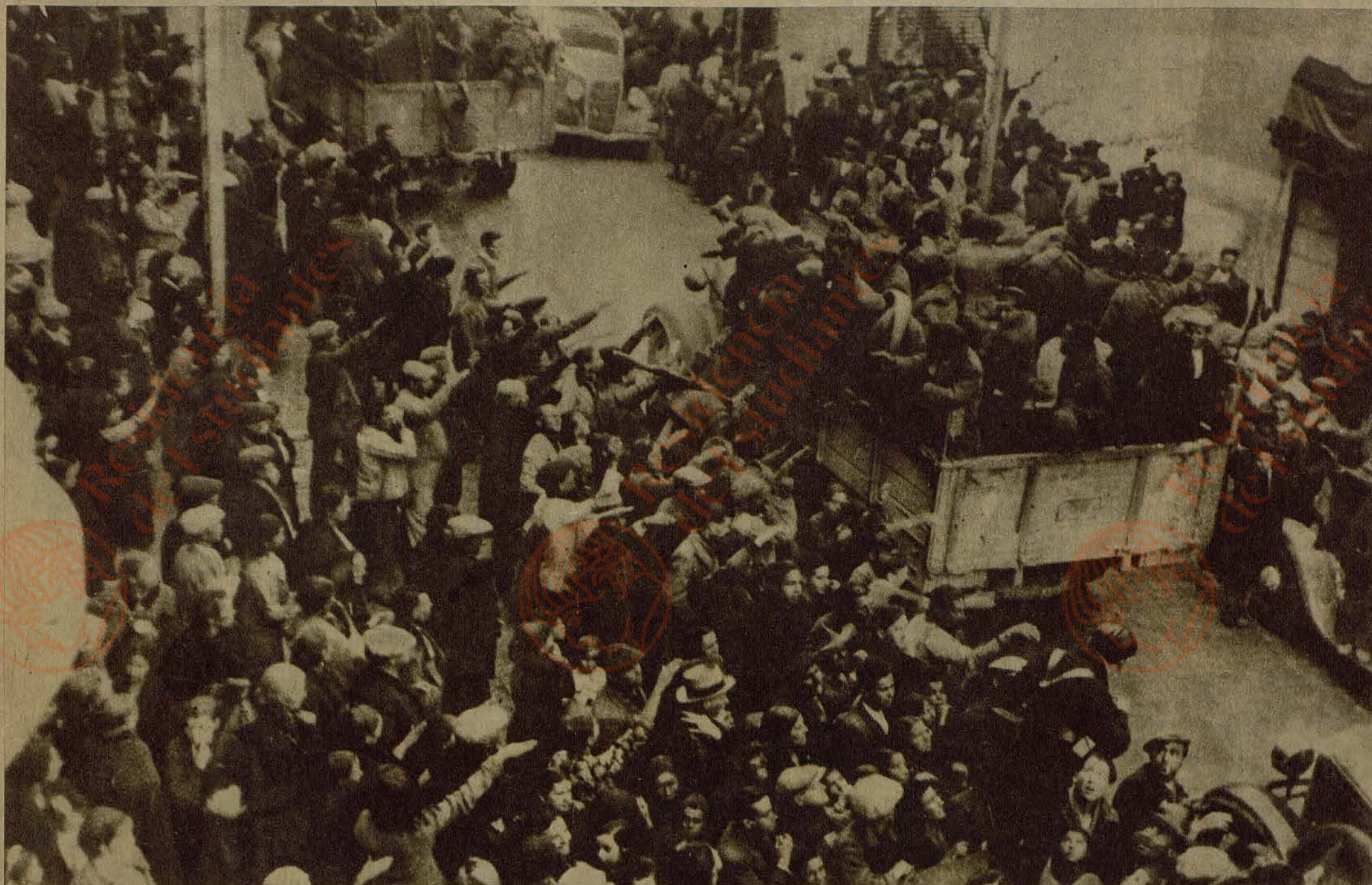
Camiones con soldados del Ejército Nacional atraviesan las calles de Jaen, entre el entusiasmo y los vitores del vecindario