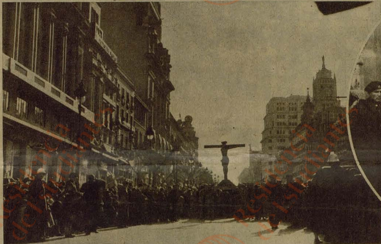
La imagen de Jesús Crucificado, bárbaramente mutilada por los rojos, a su paso por la calle de Alcalá