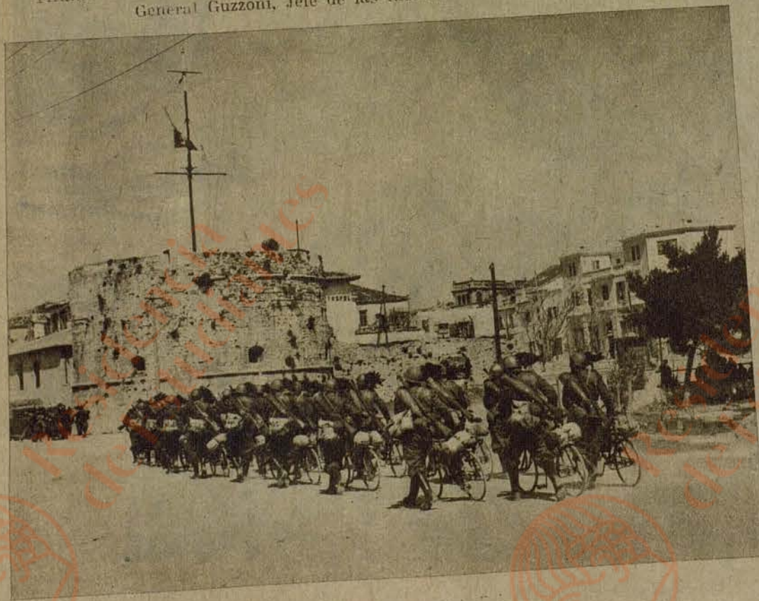
Tropas italianas entrando en Durazzo