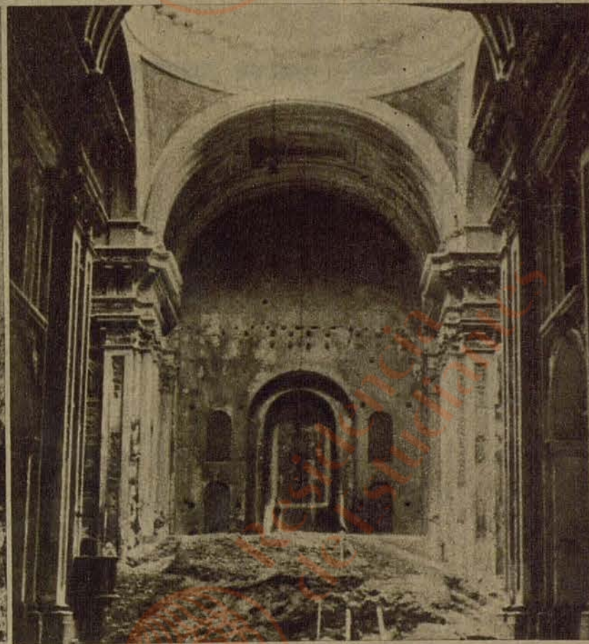
Interior de la Iglesia Catedral de Madrid, profanada y destruida por los rojos. En la hornacina del altar mayor se veneraba el cuerpo de San Isidro Labrador, patrón de Madrid, el cual ha desaparecido