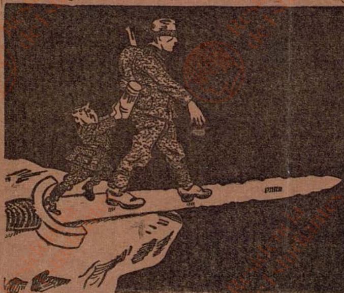
Hitler stößt das deutsche Volk in den Abgrund

Anzahl von Menschen vernichtet, dem Feind eine beträchtliche Menge technischer Kampfmittel abgenommen und ihn gezwungen, seine für das Frühjahr bestimmten Reserven vorzeitig zu verbrauchen. Ausgehend von diesen Tatsachen hielt es Stalin für zeitgemäß, der Roten Armee den Befehl zu geben, im Jahre 1942 den Sieg über Hitler zu erringen."