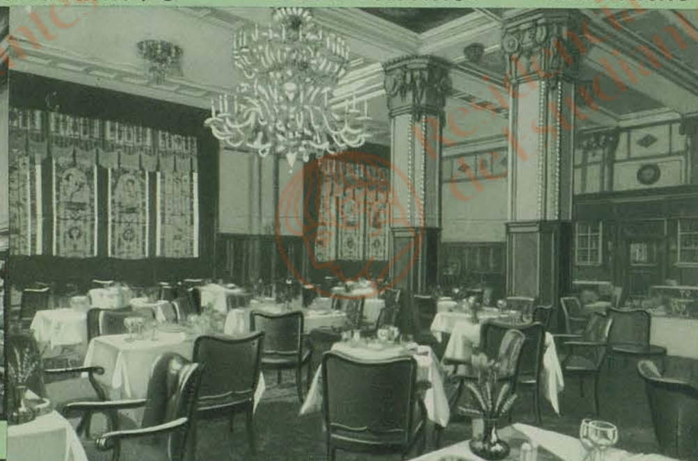
Hotel Excelsior Weinrestaurant