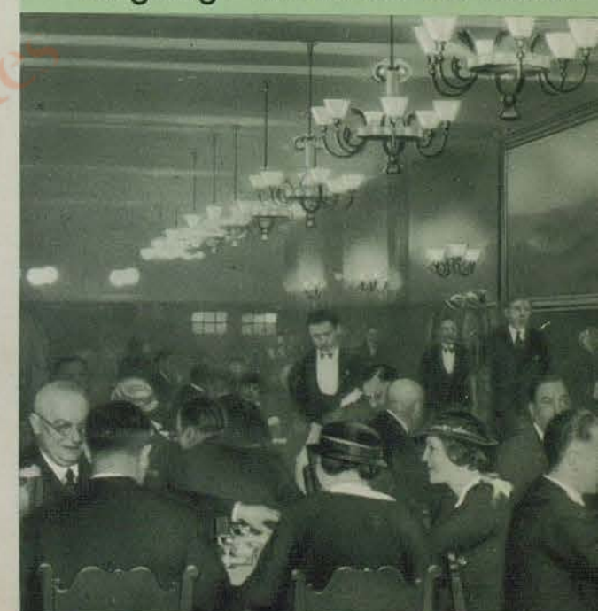
Hotel Excelsior Zum Augustiner-Bräu u. Pilsner Urquell