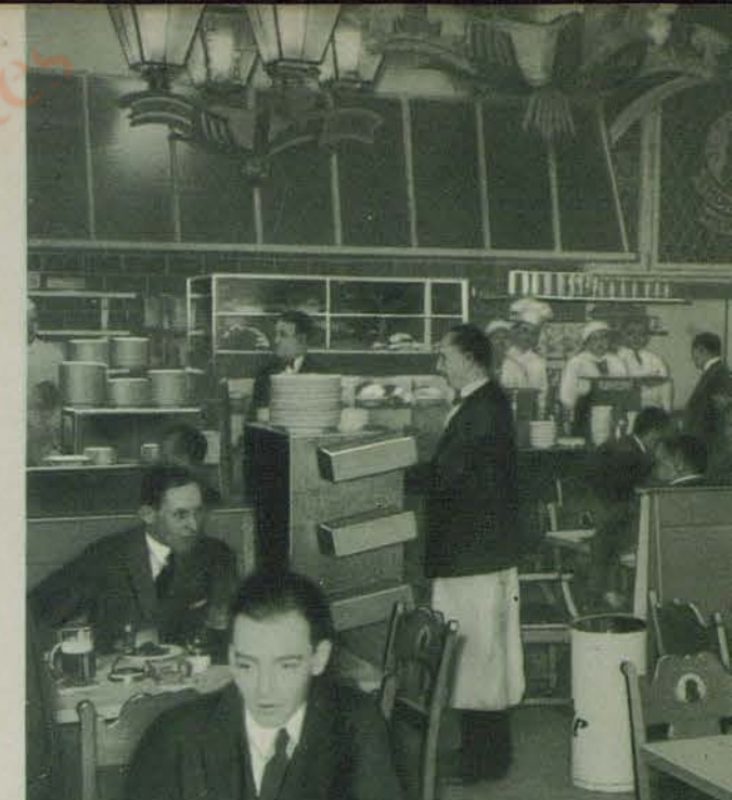
Hotel Excelsior Stadtschänke

Auf die Zimmerpreise wird ein Bedienungszuschlag von 15% auf den Restaurant-Verzehr von 10% erhoben.