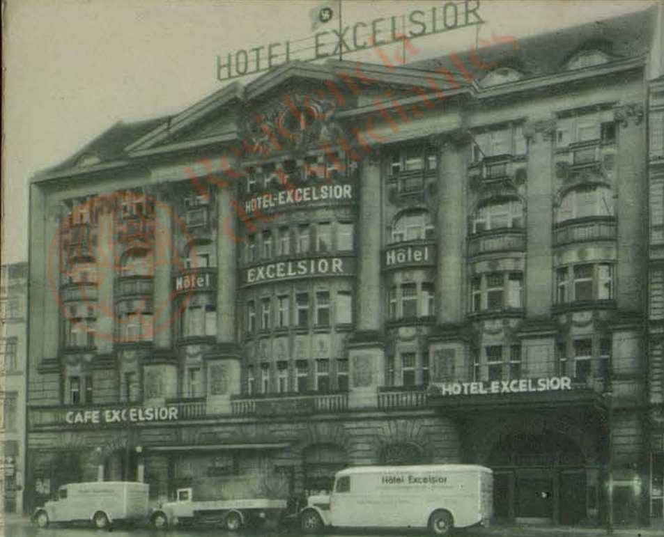
Hotel Excelsior Berlin, Saarlandstr. 78