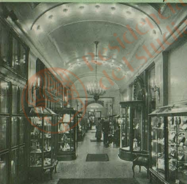
Verkaufsstraße im Hotel Excelsior