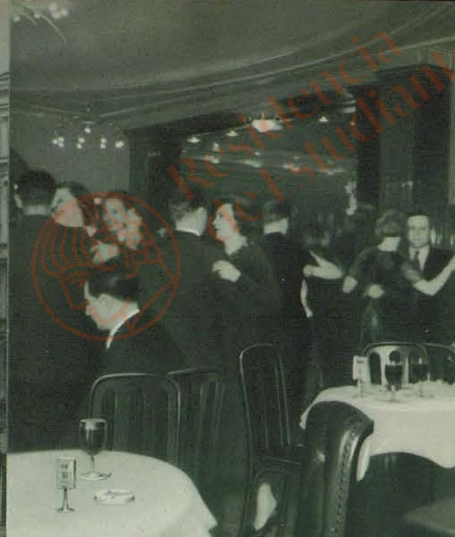
Hotel Excelsior Tanzfläche