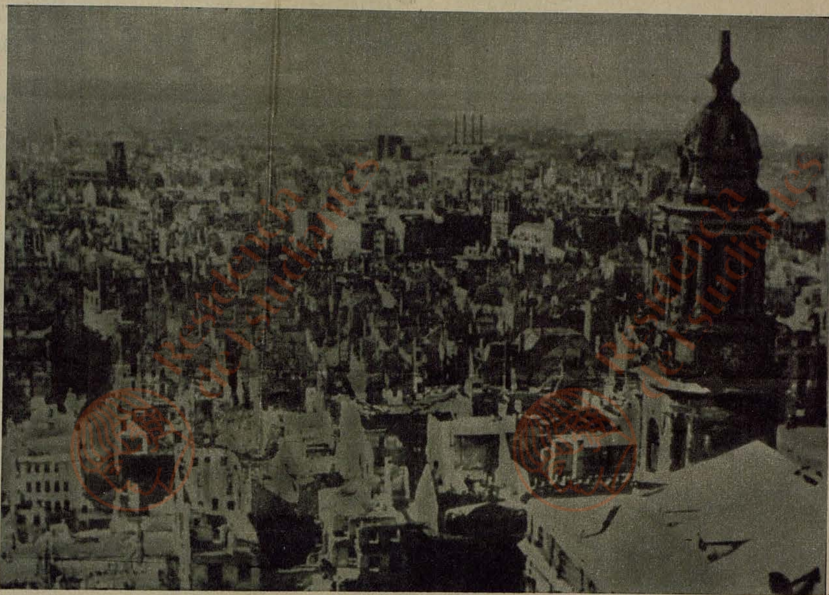
Una vista de Dresde tras los bombardeos del 13 y 14 de febrero de 1945

Aviación británica, atacó Dresde con diez mil bombas explosivas y 650.000 bombas de fósforo. ★ Miles y miles de personas quedaron convertidas en antorchas. Una segunda oleada de «Lancaster» cerró los caminos que podían facilitar la huida y, a las trece horas del día 14, la presencia de mil «fortalezas volantes» y cientos de cazas ultramodernos, que disparaban sin cesar, aniquiló a los supervivientes que habían conseguido trasladarse a los alrededores de esta ciudad. Dresde quedó exterminada. Sus víctimas sobrepasaron a la suma de las que seis meses después sobrevendrían en Hiroshima y Nagasaki y fueron tres veces más que las registradas en todas las incursiones aéreas alemanas sobre la Gran Bretaña.