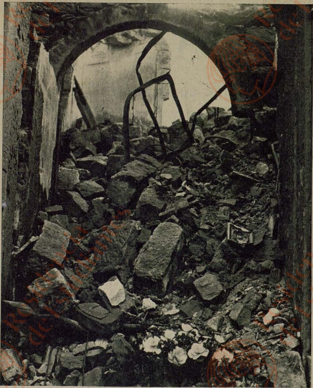
Unas rosas sobre los escombros donde alguien creyó que habían quedado enterrados los seres queridos