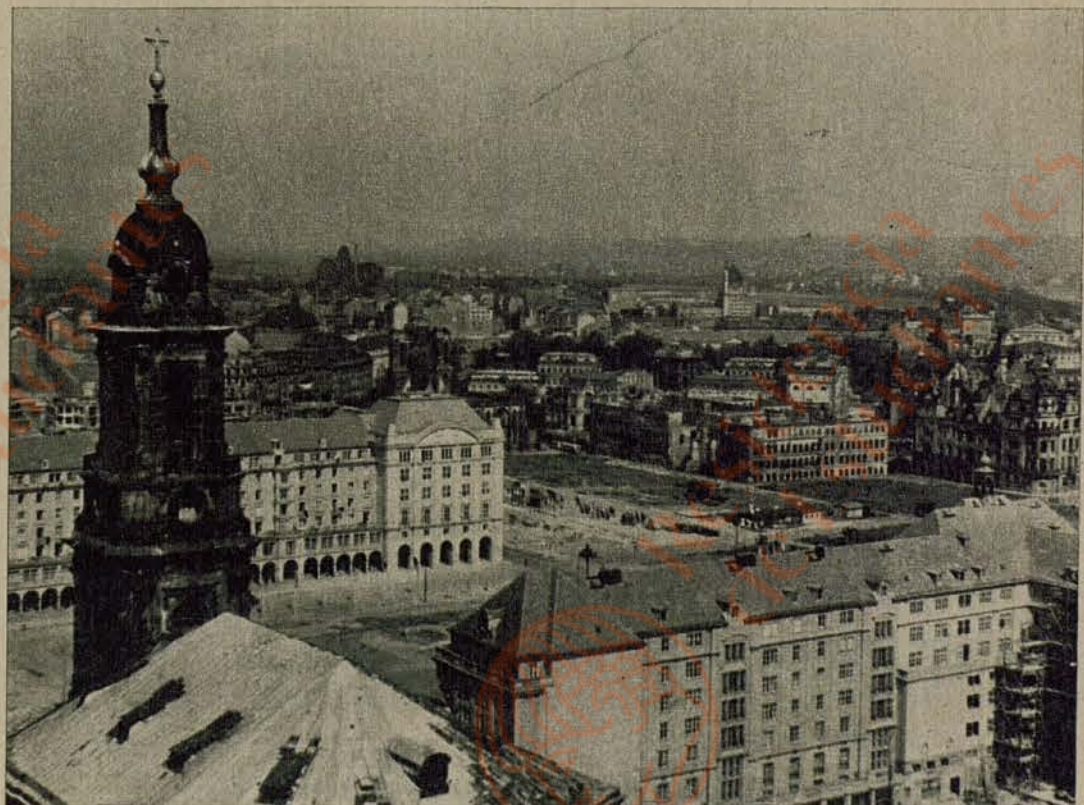
En 1956, Dresde había comenzado ya a renacer entre sus propias cenizas