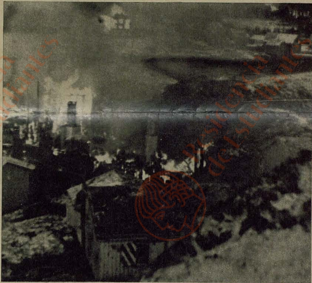
Los alrededores de Dresde ardiendo en la madrugada del 14 de febrero