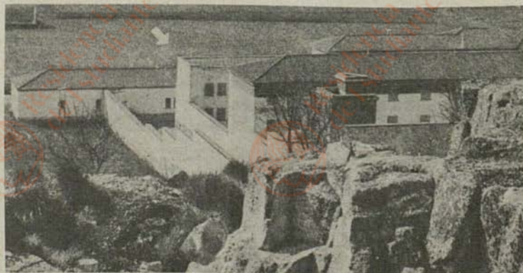
Prisión de Zamora: El ala de los sacerdotes vascos (flecha).

SABINO DE ARANA Y GOIRI (patriota vasco)