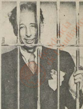
El Presidente de la Generalitat de Catalunya, Luis Companys, entregado por la Gestapo a Franco y fusilado en Montjuich el 15-10-1940.

BARCELONA (Corresponsal de EGI).—La evolución política de la postguerra en Cataluña, desde los días negros de la década del 40, ha sido, sin embargo, constante y encaminada a presentar un frente común de lucha contra el régimen español. Desde aquel primer comité "Ametlla" del cuarenta y pico, pasando por la "Faula Rodona" y la "Coordinadora de Forces Politiques de Catalunya", hasta la actual "Asamblea de Catalunya", ha pasado un tiempo no baldío.