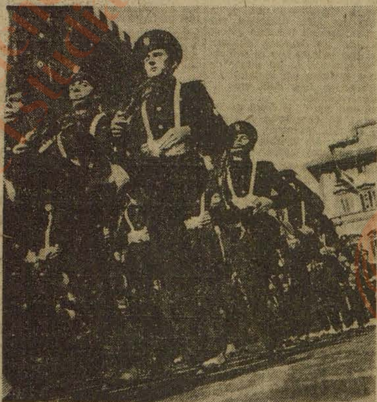
Causa cierta sorpresa, al ver desfilar a las Juventudes Italianas, el contraste tan profundo entre el bañista y el cadete, tan vistoso éste con su uniforme azul, su corbata blanca, su armamento idéntico al de guerra, su aire marcial, de soldado modelo.

La cifra cada día creciente de los afiliados a la G. I. L. llega en estos momentos a casi los nueve millones. No se trata de una afiliación obligada. La G. I. L. tiene una bandera voluntaria. Pero, ¿quién se sustrae en Italia a su atracción deslumbrante? De esta masa, cuando llegan los dieciocho años, el elemento masculino ofrece ya al Ejército una selección. Se inicia en ellos la preparación militar. La que pudiera llamarse general. Primer período de instrucción. Enseñanza técnica, instrucción militar, tiro, formación de la disciplina, creación del espíritu militar del que ha de ser soldado. Lo que pudimos llamar la segunda etapa de aplicación, puesto que todos los cadetes saben marchar, desfilar, ser soldados en una palabra, antes de cambiar al uniforme de batalla por el de cadete, bien distinto en todos los aspectos y en su armamento, que entonces comienza a ser enteramente "de verdad". LA G. I. L. DA MILES DE SOLDADOS ESPECIALIZADOS Cuando esta preparación ha quedado terminada, entonces la G. I. L. forma su selección y distribuye las levadas entre las distintas secciones. Llega el momento de la formación de los especialistas. Primeramente, en la amplia acepción de las tres Armas: Tierra, Mar y Aire. Después, la milicia y fuerza armada, que constituye grupo aparte. No perdamos nuestros lectores que este trabajo carezca de cifras cifradas. Estancos en guerra. Pero si daremos alguna referencia. Solamente en las tropas de Tierra, la G. I. L. tiene 24 secciones.