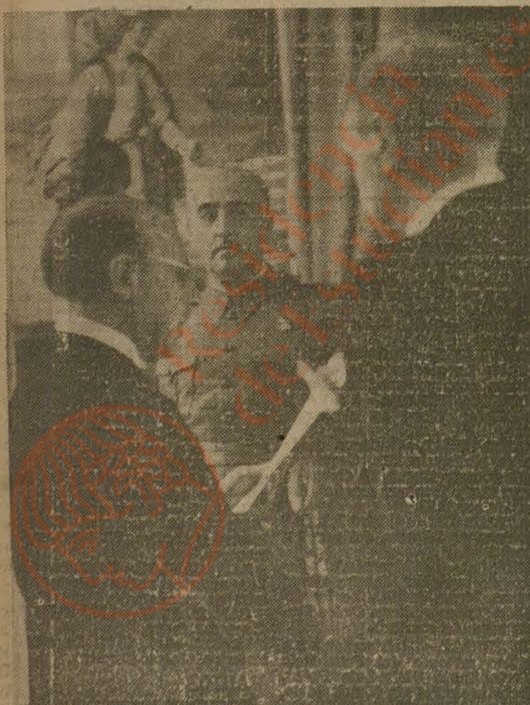
Momento de prestar juramento del cargo de ministro el general Gómez Jordana