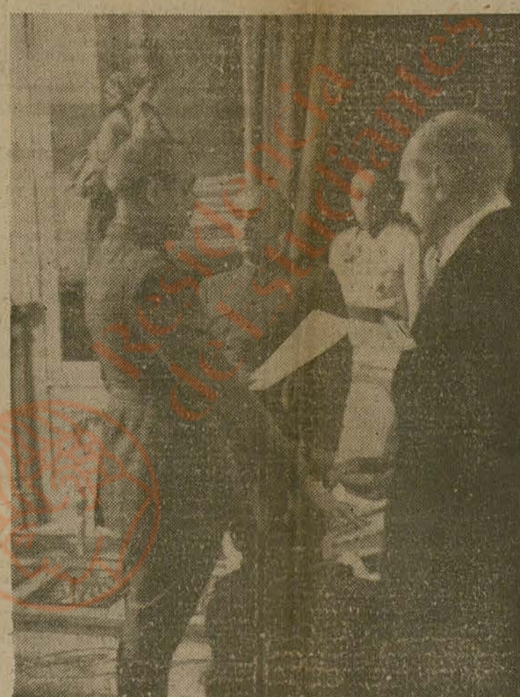
El nuevo ministro del Ejército, general Asensio, prestando juramento

Terminada la ceremonia, los ministros se reunieron bajo la presidencia del Caudillo.