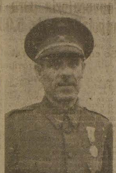
El nuevo ministro del Ejército, general Asensio Cavanillas

Ingresó en la Academia General Militar el año 1892. Promovido a segundo teniente de Infantería en 1895, pasó al Ejército de Cuba. En 1896 fué gravemente herido en el combate de Alcáncora y Cerey. Ascendió a primer teniente por el mérito contraído en dicha acción.