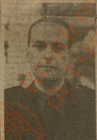
Camarada Blas Pérez González, ministro de la Gobernación