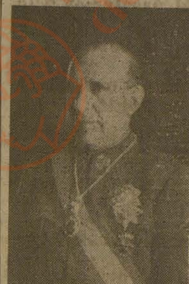
Excelentísimo Sr. D. Francisco Gómez Jordana y Sousa, ministro de Asuntos Exteriores

TOKIO 3. — El castellano seguirá hablándose en los Tribunales filipinos, según decisión que acaba de tomar el primer magistrado del Tribunal Supremo de aquel país, José Laurel. La medida obedece al hecho de que parte de las leyes filipinas se fundamentan en el Derecho español, que muchas sentencias se encuentran redactadas en castellano y que son muchos los abogados filipinos que hablan en ese idioma. (Efe.)