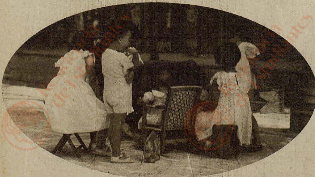
Hasta los chiquillos van limpios, que es el colmo. Los que andan a gatas y los que se pasan el día en la calle jugando hasta rendirse.