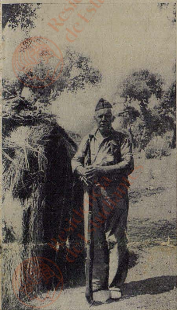
Si hay entusiasmo todas las edades son buenas para luchar por la causa de la libertad. Este viejo obrero se bate en el frente desde los primeros días de la insurrección.