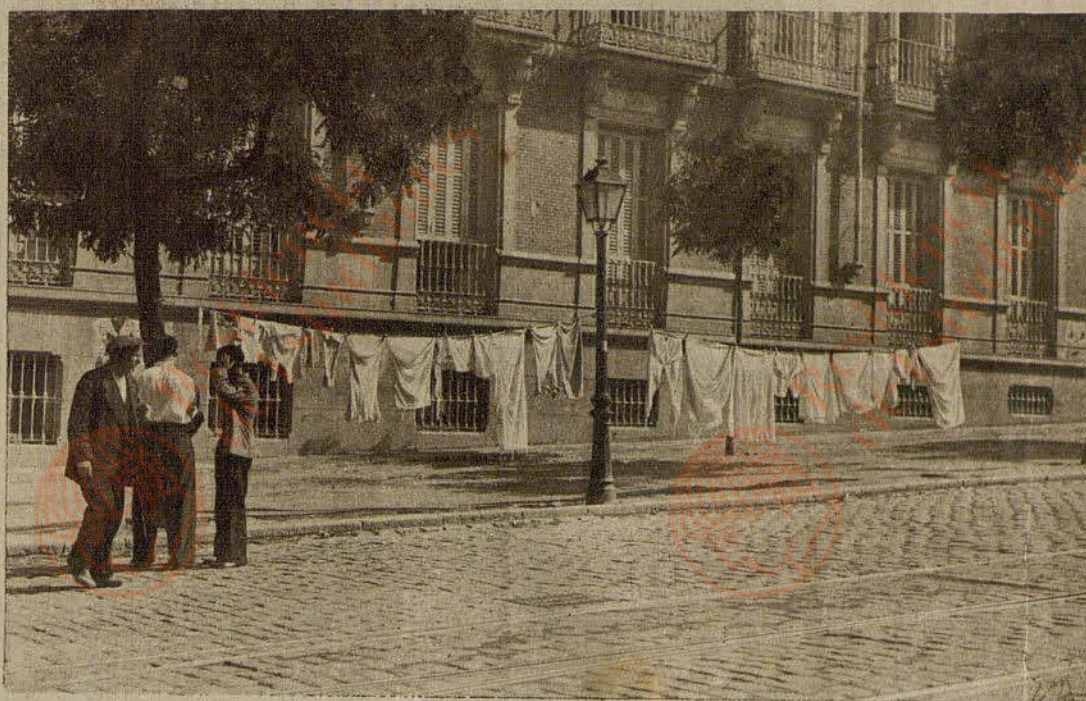
...Y las cuerdas atadas de árbol a árbol en las rectas avenidas de los bulevares, un poco cercanas a la periferia, llenas de prendas colgadas.

Hay que ver—sin música—cómo van las mujeres por los bulevares del barrio que fué aristocrático. Y por la calle de Alcalá, Gran Vía, Carrera de San Jerónimo, la Castellana. Trajes vaporosos, blusas blancas, faldas claras, limpias y planchadas, que es un encanto. Maquilladas con maestra coquetería. Taconeando con paso, que es un repiqueteo de estilo propio. Con tipos de eurytmia estilizada, lograda hoy, sin régimen alimenticio, y en virtud de un culto obligado a la frugalidad, que si no alimentara el optimismo, degeneraría en una tuberculosis romántica.