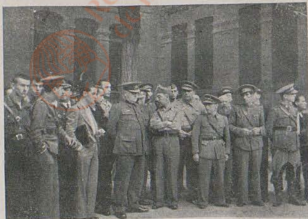
El General Miaja presenciando las prácticas realizadas por la primera y sexta compañías.

Nuestro saludo a los camaradas que a pesar de hallarse lejos, se encuentran espiritualmente a nuestro lado.