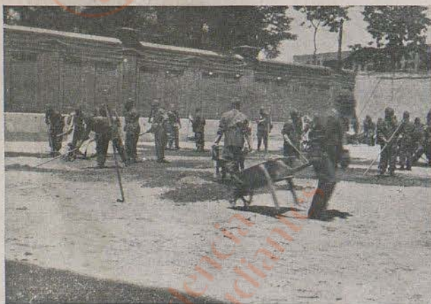
La primera Compañía durante las prácticas hechas ante el General Miaja.