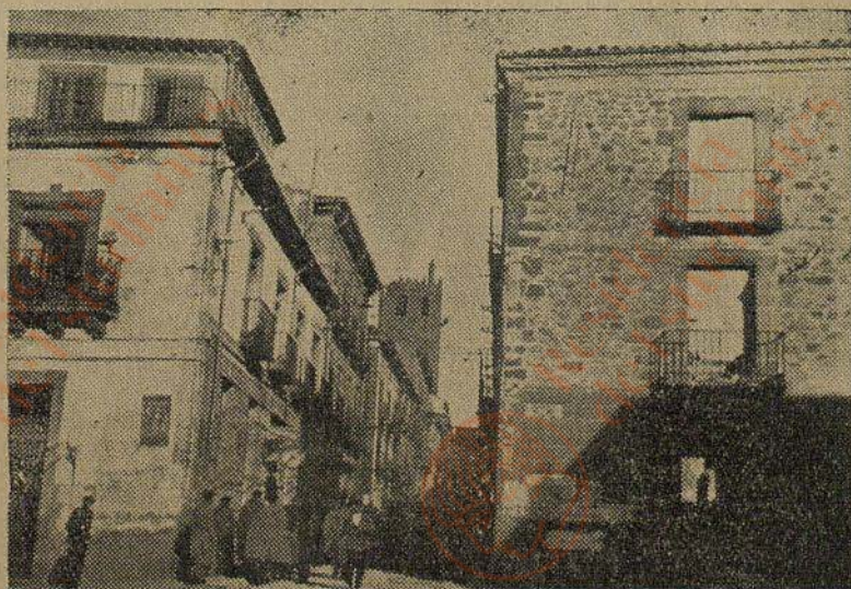
SIGÜENZA.—Calle del Cardenal Mendoza.

HILARIO YABEN Vicario Capitular de Sigüenza.