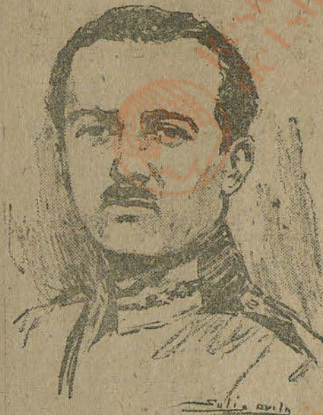
Ahmed Zog, Rey de Albania.

mensaje haciéndose intérprete del alegre orgullo de la población albanesa al acoger a los soldados de la poderosa Italia y de la indefectible fidelidad de esta población hacia Italia y su Duce, que tantas veces ha demostrado su benevolencia hacia la nación albanesa. La Junta se ha declarado convencida de que Italia realizará el programa que trazó esta mañana el conde Ciano y asegurará a Italia el orden, la prosperidad y la jus-