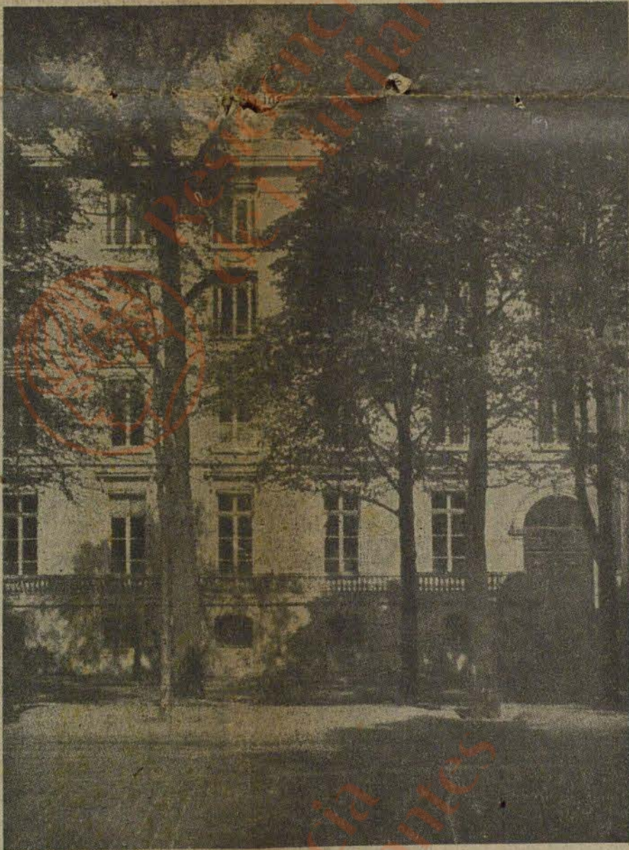
Generalsekretariat der Internationalen Handelskammer in Paris

that this Congress in Berlin will register a particularly high attendance figure. The record participation in the Paris Congress of 1935, representatives from 40 countries will be surpassed and, as a result of the unexpectedly large number of notifications already received, it has been found necessary to relinquish the Kroll Opera House in Berlin for the opening meeting in favour of the greater accommodation of the German Opera House in Charlottenburg. It may be safe to remark, that the desire to become acquainted with the new Germany at close quarters has, in part, prompted this great influx.