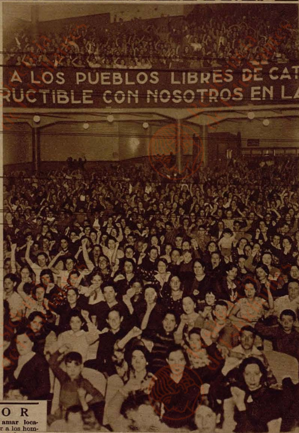
La sección de propaganda del Ministerio de Instrucción Pública ha organizado, en el Monumental Cinema, una proyección para las obreras de Madrid de la película "Los marinos de Cronstadt", que con tan extraordinaria concurrencia está dando en el Capitol.

Para hacerse amar locamente. Dominar a los hombres, conquistar a las mujeres. Mandad vello de 0,30 y recibiréis "La Llave del Amor". Librería Pons, Buenavista, 11, G-Barcelona