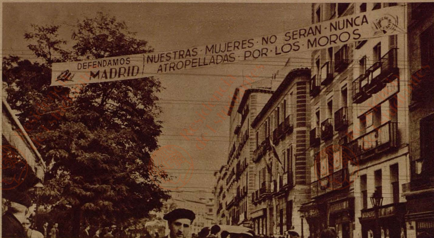
Madrid se ha movlizado. Manifestaciones, charlas ardorosas, proclamas y desfiles de gentes armadas le dan el aspecto animoso de ciudad en pie de guerra.