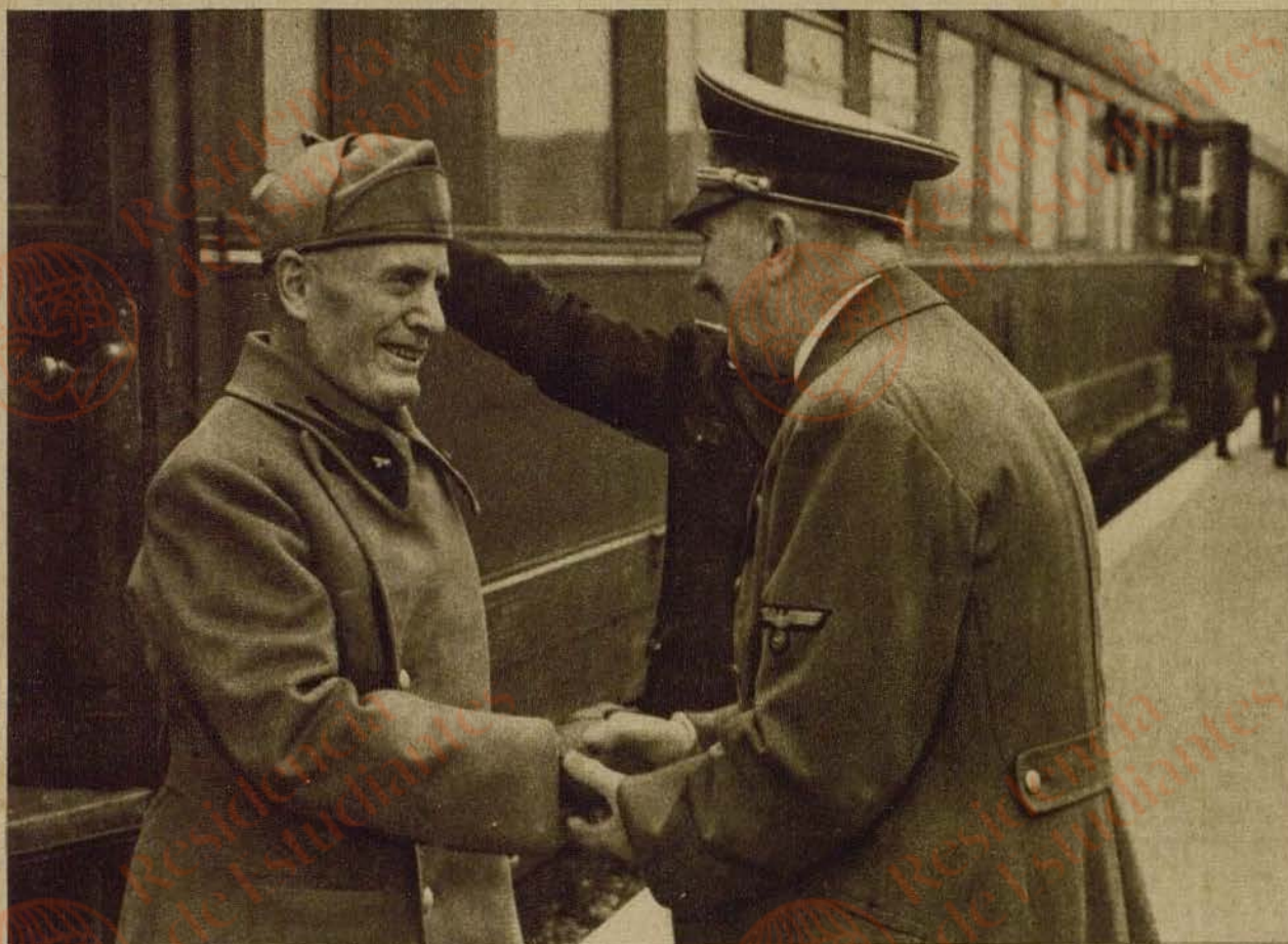
LA ÚLTIMA ENTREVISTA HITLER-MUSSOLINI. — El Führer saluda a Benito Mussolini a su llegada al Gran Cuartel General

Mussolini estrecha la mano a von Ribbentrop, ministro de Asuntos Exteriores del Reich →