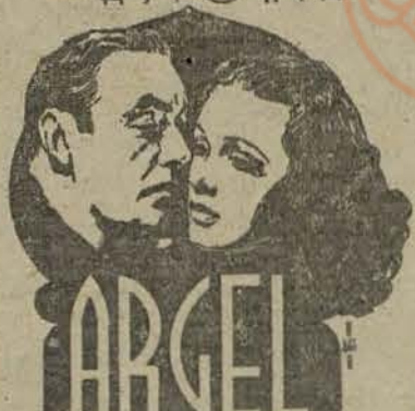
ARGEL Charles BOYER-LAMARR (No apta para menores)

«Pastor Angelicus» es la joya cinematográfica en la que constantemente estamos viendo a Su Santidad bendiciendo, confortando y auxiliando a los que a él acuden, llena de emoción los corazones y hace que su bondad se fije mejor en nuestros sentimientos.