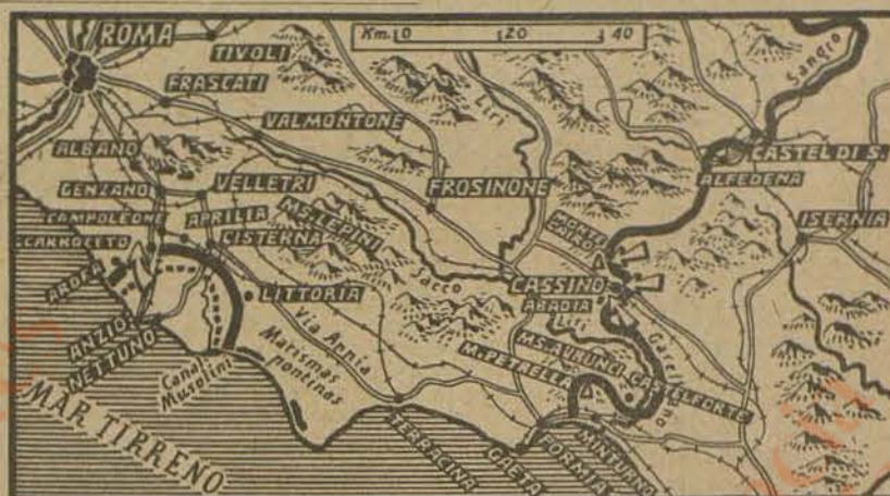
Los dos frentes de Italia

La mejoría del tiempo, al permitir la llegada de refuerzos, canadienses y franceses especialmente, el uso muy activo de la aviación táctica y estratégica y, sobre todo, el inestimable apoyo de los grandes cañones de la artillería naval, han permitido al Mando anglosajón conjurar una situación que llegó a anunciarse gravísima.