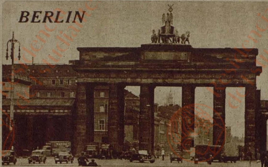
La famosa Puerta de Brandenburgo