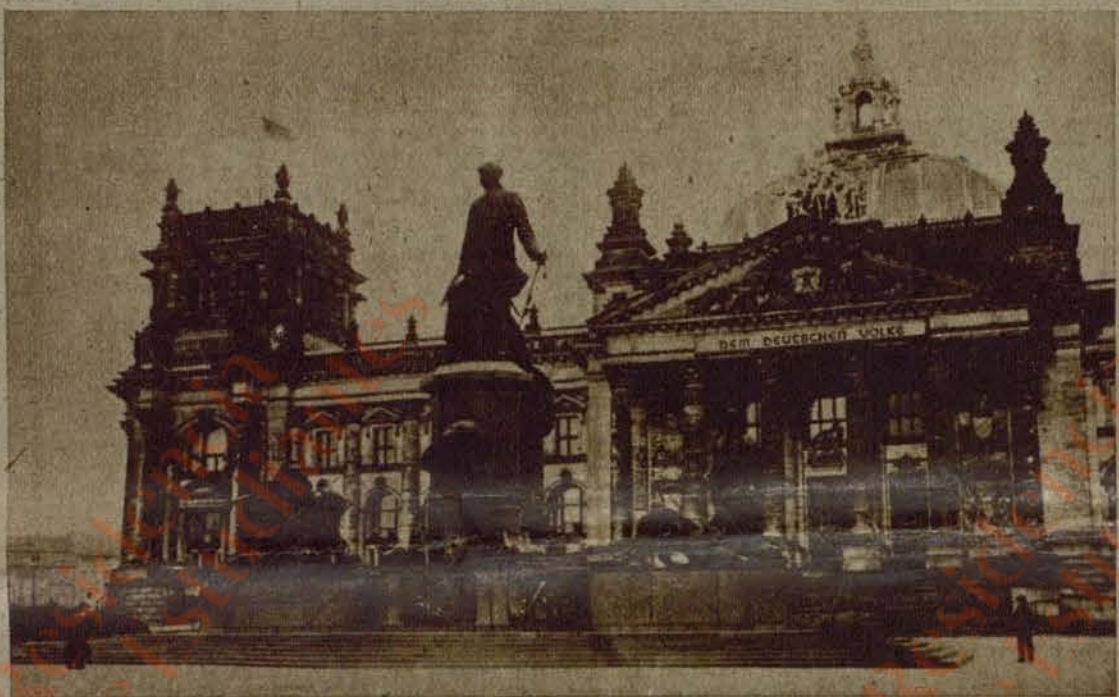
Una vista del Reichstag