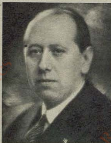
José María Gil Robles

La tesis es rotunda: "fracaso sin paliativos. Los juicios son siempre adversos: "ignominioso episodio de la quema de conventos"; "las turbas rodearon, con el intento de asaltarlo, el hotel donde me alojaba; irrumpieron en las oficinas electorales del Bloque Agrario, destrozando cuanto allí se encontraba"; "una masa inspirada en móviles negativos"; "momento pasional y, por lo tanto, de acusado matiz extremista"; "proceso de continua radicalización"; "el balance de la actividad de esa etapa de gobierno es negativo"; "claudicación espiritual ante la apasionada demagogia"; "absoluta intransigencia"; "pasión destructora de las izquierdas revolucionarias"; "espíritu de injusticia"; "triunfaba siempre el sectarismo de los partidos extremos"; "a las invectivas e insultos que salían de los escaños se sumaba el tumulto de las tribunas"; "la persecución religiosa y el separatismo unidos a la anarquía nacida de la conjunción de propagandas disolventes, con un poder político débil y claudicante, condenaron a muerte a la República"; "escándalo inenarrable"; "se entabló en el hemiciclo una verdadera batalla campal"; "discursos que fueron auténticos monumentos de sectarismo, necedad y pedantería"; "estalló el tumulto