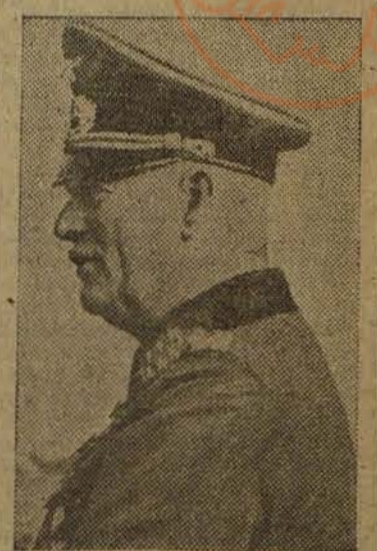
KEITEL: "Dios proteja a Alemania"

LONDRES, 16.—Fuera del Palacio de Justicia y de la prisión no