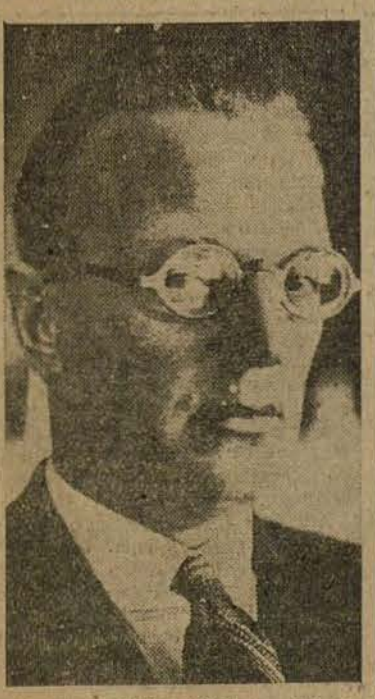
SEYSS-INQUART: "Muero creyendo en Alemania."

PARIS, 16.—El público parisien ha reaccionado con asombro ante la noticia del suicidio de Goering en la prisión de Nuremberg. El diputado comunista Marcel Cachin, que ha sido el primero en comentar el tema de las ejecuciones, declaró: "Esto es el colmo. Creará una intensa irritación popular en todas las naciones".—EFE.