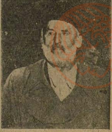
STREICHER: "Heil Hitler".

NUREMBERG, 16.—La última comida de los sentenciados a muerte, según han manifestado los fun-