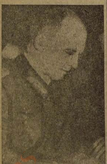
JODL: "Con la cabeza erguida como oficial prusiano."

El "Daily Express", conservador, dice: "El crimen de los jefes nazis tuvo un mezquino comienzo. La mano de la Policía simplemente podía haberle puesto fin. En cambio, creció hasta su peligroso