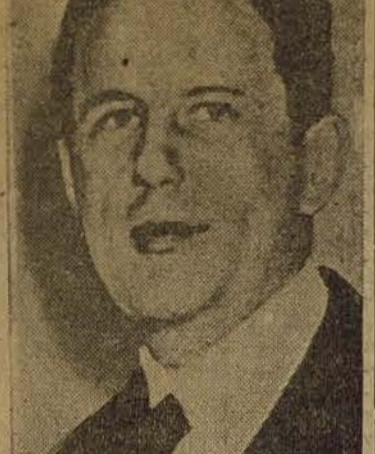
KALTENBRUNNER: "Serví a mi país, cumplí con mi deber y no soy culpable."

NUREMBERG, 16.—La decisión del Consejo de Control Aliado de no permitir a los periodistas asistir a la ejecución de los conde-