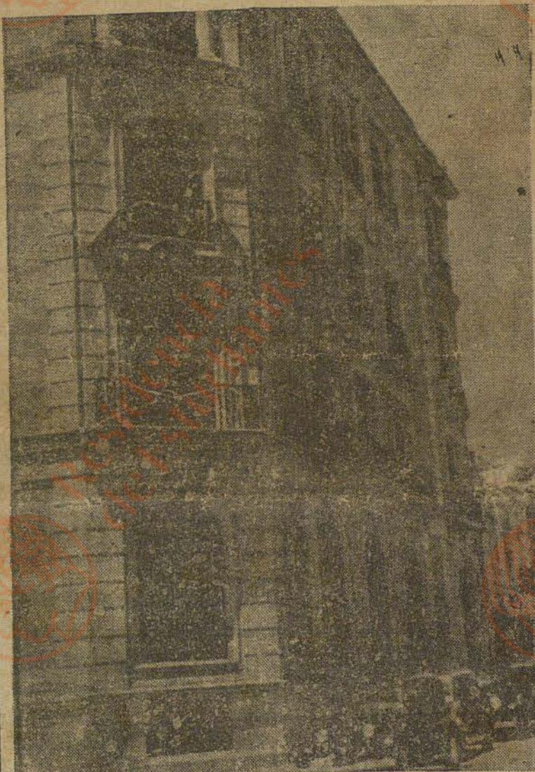
La casa de la calle de Velázquez donde vivía el señor Calvo Sotelo.

EL FERETRO FUE LLEVADO EN HOMBROS POR LOS DIPUTADOS DE DERECHAS