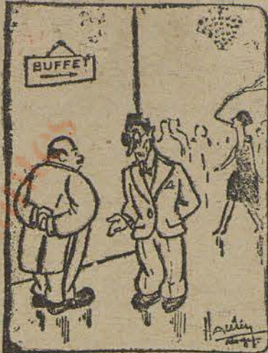
—¿No baila usted con esa joven vestida de negro?

—Jamás en la vida!... Fuma mucho, y llevo gafas de celuloide.