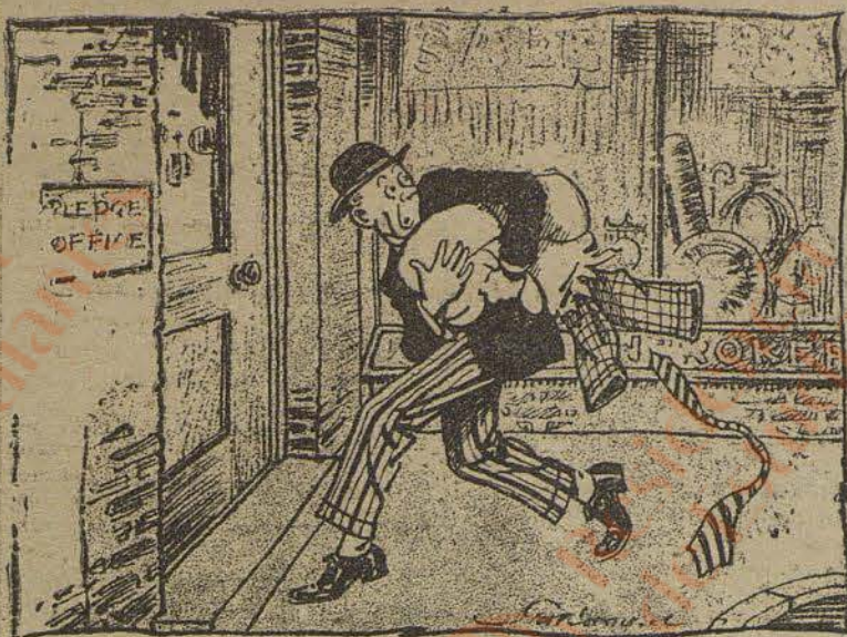
... y sonaron los despertadores.