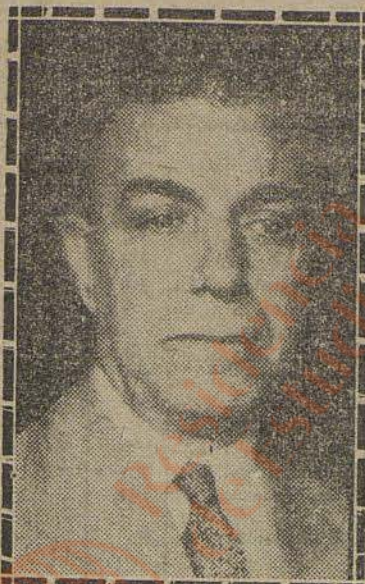
Don Alfonso Danvila, actual embajador de España en París, que ha sido nombrado para igual cargo en la Argentina.