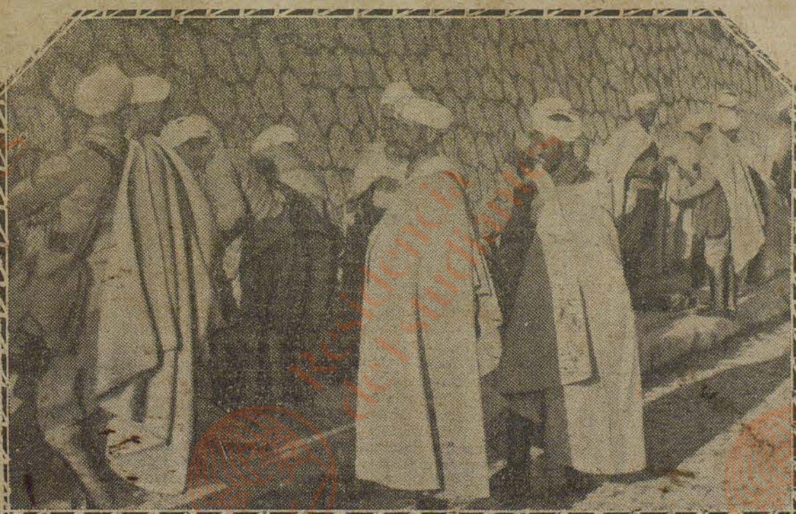
Llegada a Madrid de las fuerzas de Regulares, para asistir a la formación con motivo de la proclamación del Presidente de la República.

¡Ya era hora! El ministro de Hacienda va a re-