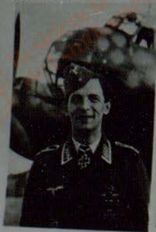
Bordschütze: Ritterkreuzträger, Oberfeldwebel Günter Glasner.

Verwaltungsangestellter — Ritterkreuzträger im II. Weltkrieg * 8. 2. 1916 † 10. 7. 1975